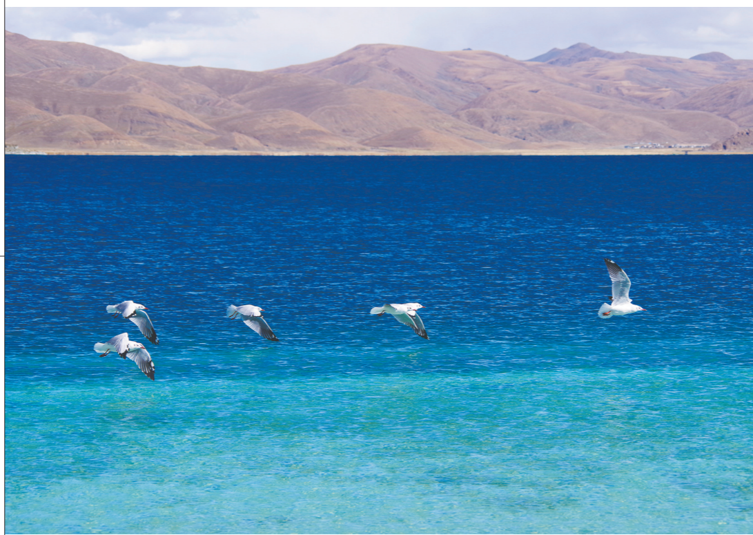
入画 (摄影) □唐胜一