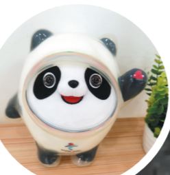
▲冰墩墩硅胶外壳为东莞制造 ►冰墩墩硅胶外壳生产模具