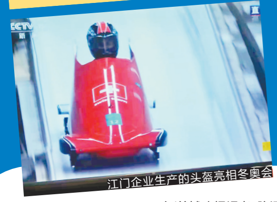
江门企业生产的头盔亮相冬奥会 文/羊城晚报记者 陈泽云 实习生 王仪

“大湾区制造”也在北京冬奥会上亮了，它们的背后折射出哪些产业新风向？又预示着哪些行业新趋势和消费新潮流？今起推出的《从冬奥会看“湾区制造”新风向》系列报道，与您一起观察其中的端倪。