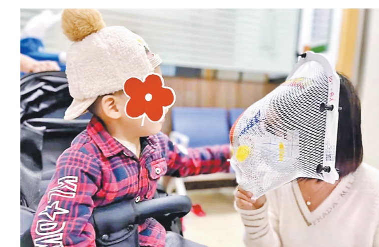
医护人员画了一个奥特曼放疗面罩，鼓励小辰勇敢战胜病魔

员的陪伴，面对病魔，他多了一份乐观与信心。 肿瘤的治疗本身就很难痛苦，为减少孩子们治疗时的痛苦与恐惧，医院推出了不少暖心举措。比如近期，中肿放疗科6号机房进行“迪士尼”风格装饰改造，集中日班时段安排儿童放