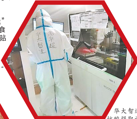
华大智造的核酸提取设备

另一方面，华大智造云影远程超声机器人还可以实现“医患无接触”诊断。冬奥会期间，一边有病人端部署在闭环诊室内；在另一边，超声科医生通过医生端远程探头，即可在