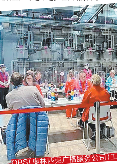
OBS(奥林匹克广播服务公司)工作人员在智慧餐厅用餐

面对广阔的市场前景，数字型智慧产业如何与社会生活相结合，是大湾区企业正在探索的方向。以餐饮方向为例，据品牌负责人介绍，千玺集团目前主要布局了三个业务方向：一是供应餐饮机器人单机设备，目前已有近2500台在全国30个省市的景区、学校、医院、交通枢纽等多样化场景中落地运营；二是开设机器人餐厅，经过探索和优化，目前在佛山、广州两地开设了餐厅；三是提供智慧餐饮解决方案，向传统餐厅、企事业单位食堂等餐饮空间，提供智能化升级定制服务。未来，广东“智”造的靓丽风景线将出现在商场、学校、工厂等越来越多社会场景中。