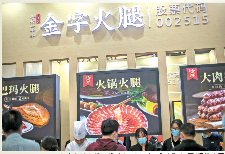
金字火腿替婿还钱的“A股好岳父”刷屏了