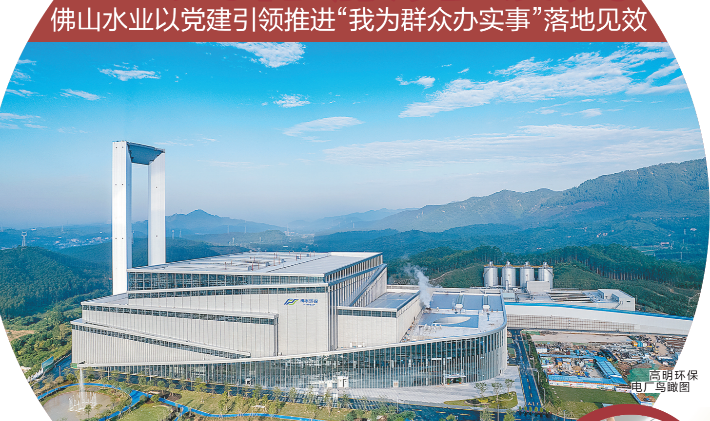
高明环保电厂鸟瞰图