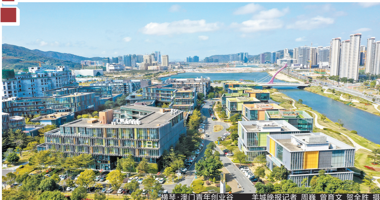
横琴·澳门青年创业谷