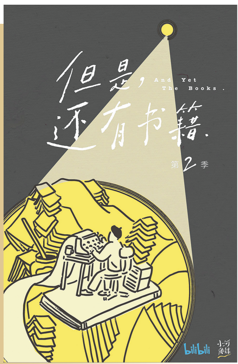
羊城晚报记者 胡广欣

纪录片《但是还有书籍2》在2月24日收官。播出一个多月以来，这部六集体量的纪录片总播放量超过1650万次，豆瓣评分稳居9.5分。