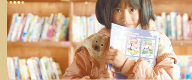
图书馆是“诗和远方”

时隔三年归来的《但是还有书籍2》，其口碑和播放数据甚至优于第一季。这套纪录片为何能得到如此多观众的喜爱？作为一套关于书的纪录片，《但是还有书籍2》比起“增加知识”，更强调“精神陪伴”。