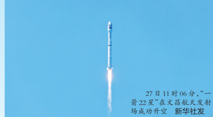
27日11时06分,“一箭22星”在文昌航天发射场成功升空

研制团队根据卫星布局,对所有箭体和卫星偏差进行多轮仿真计算,设计了12次分离动作,确保22颗卫星安心“下车”。