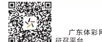
广东体彩网 征召平台

析体彩玩法走势 大乐透:前区:小号热出,大小比关注2:3防1:4。和值下降,关注70-100之间。偶数强势,关注奇偶比2:3防1:4。012路关注1:2:2。连号弱势,关注散号。后区首防一大一小,奇偶组合,次防双大、双奇组合。7星彩:620-242-303-005-781-483+1,8,9。排列3:精选号码三注:951、681、249。排列5:精选号码三注:88096、37834、57361。(福社)