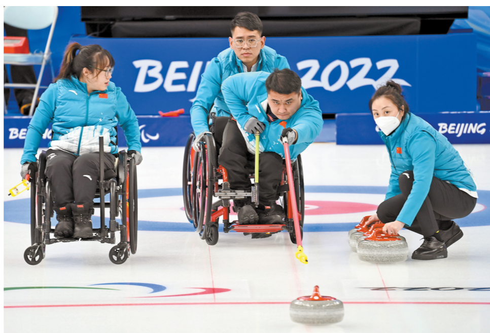
中国轮椅冰壶队在训练中

经过近年的不懈努力,我国冬残奥运动不断取得进步。2015年7月,北京携手张家口赢得2022年冬奥会和冬残奥会举办权,我国冬残奥运动随之迎来