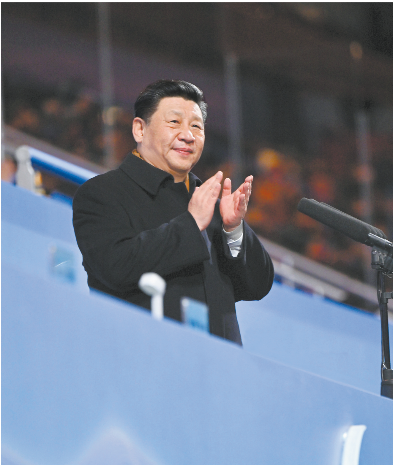
3月4日晚，北京2022年冬残奥会开幕式在国家体育场隆重举行。国家主席习近平出席开幕式并宣布北京2022年冬残奥会开幕

习近平出席开幕式并宣布北京冬残奥会开幕 李克强栗战书汪洋王沪宁赵乐际韩正王岐山 国际残奥委会主席帕森斯出席