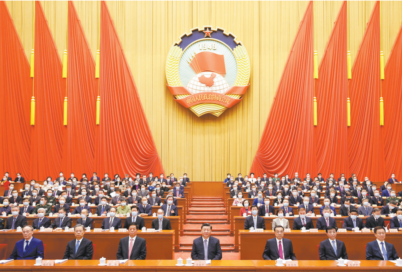
3月4日，中国人民政治协商会议第十三届全国委员会第五次会议在北京人民大会堂开幕。这是习近平、李克强、栗战书、王沪宁、赵乐际、韩正、王岐山在主席台就座