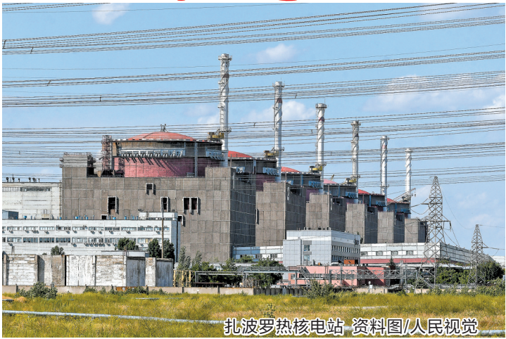
扎波罗热核电站