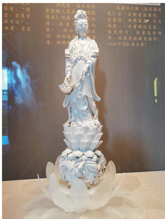
德化窑白釉瓷鱼篮观音立像(清代)

德化白瓷的观音塑像,雕琢细致精湛,造型生动传神,在众多表现观音主题的艺术作品中独树一帜,是德化瓷业发展历史上最高成就的代表。