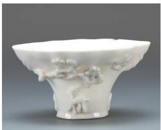
德化窑白釉贴花瓷树头杯(清代)

德化白瓷杯不仅在窑址有较多的标本出土,而且大量的完整器传世。它们造型多样,有梅花杯、海棠杯、仿犀