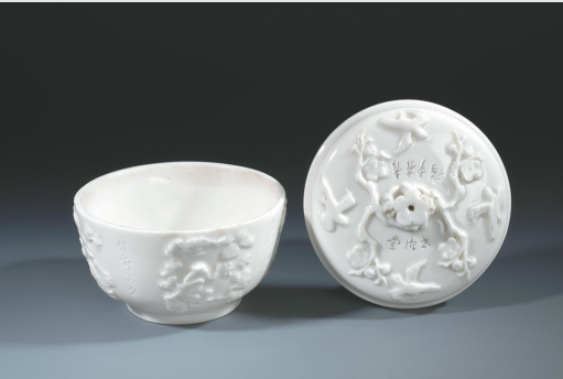
德化窑白釉堆塑瓷盖盅(清乾隆)

明清时期德化白瓷种类丰富,碗、盘、碟、壶等与日常生活密切相关的器型仍为大宗产品。