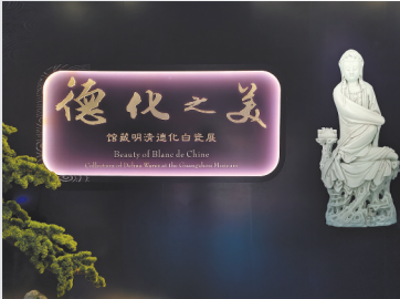
展览现场

中国陶瓷历史上,有一种瓷器,用一抹凝脂如玉的白惊艳了世界,她就是德化白瓷。而在“沉睡”了数百年之后,134件(套)德化白瓷也用这一抹白,惊艳了羊城的观众。3月2日至5月25日,由广州博物馆主办的《德化之美——馆藏明清德化白瓷展》在镇海楼展区专题展厅展出。