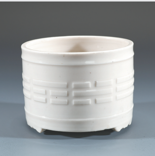
德化窑白釉印八卦纹三足瓷炉(清代)

中国传统的居室文化中,陈设器是重要的组成部分,除可营造居室环境,更彰显主人品味与精神气质。明代中后期,随着宗教的世俗化,祭祀成为民众祈求诸神保佑或驱灾避难的一种日常生活习惯。