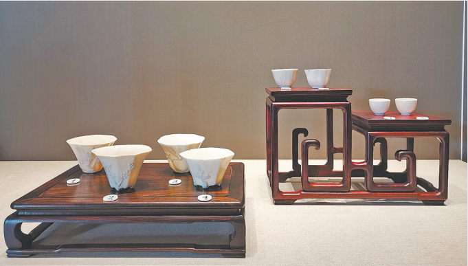
明清时期的德化窑白瓷杯

西方最早记录德化白瓷的是意大利著名旅行家马可·波罗,他于1275年到达元朝的首都,游历中国17年,为世人留下《马可·波罗游记》(又名《马可·波罗行记》、《东方闻见录》),激起了欧洲人对东方的热烈向往。