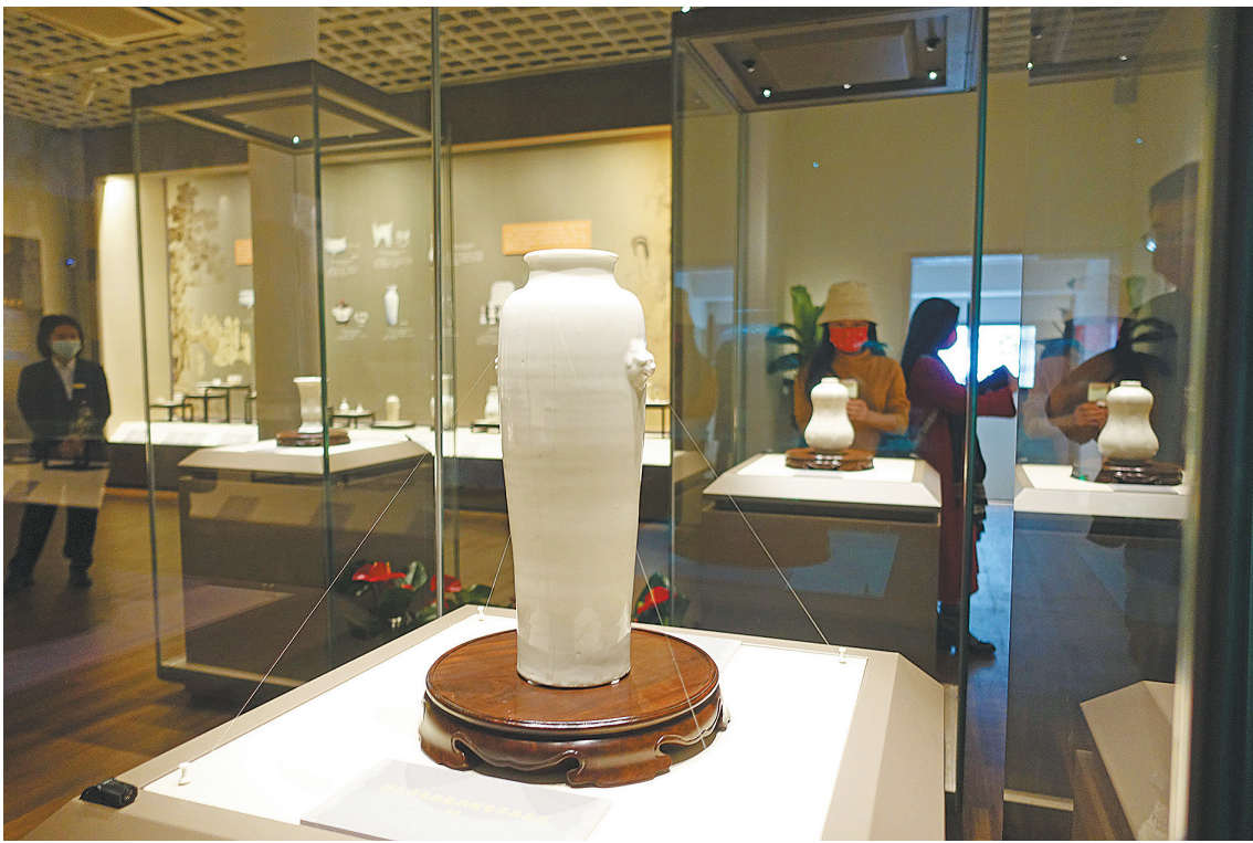
“德化之美——馆藏明清德化白瓷展”现场