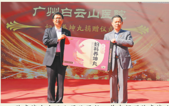
陈李济向白云山医院医护人员捐赠陈李济名优产品妇科养坤丸

从古至今，国家发展、民族兴旺、社会进步，都离不开女性的巨大力量。在脱贫攻坚的“她奉献”，征战于新冠疫情前线付出的“她力量”，以及奋斗新征程中的“她精神”……每一位中国女性都代表着一种温暖而坚定的力量。 3月8日晚，广州塔上“陈李济凝聚她力量 致敬新时代女性”字样环绕塔身，灯光璀璨，形成独特的广州塔塔景。借助广州塔作为广州地标的宣传影响力，陈李济呼吁社会大众要重视关心新时代的女性，让尊重和关爱女性成为时代新风尚，向每一位平凡而伟大的中国女性致敬！