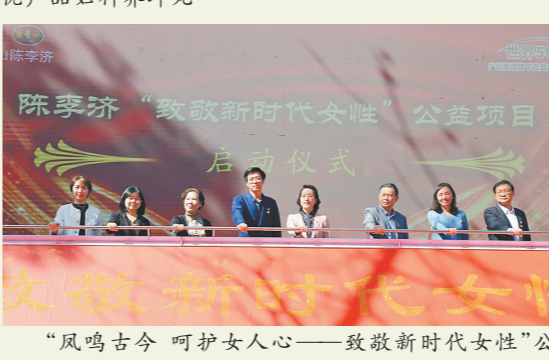
“凤鸣古今 呵护女人心——致敬新时代女性”公益项目陈李济公益项目启动