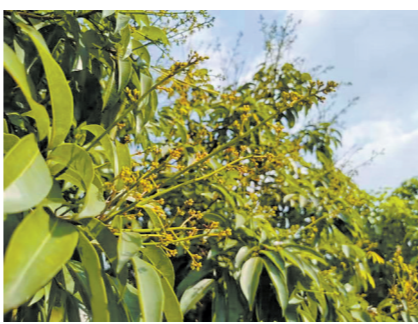
今年“观音绿”出花早、花量大

记者在金河社区岭南荔园看到，不少荔枝树上开始结出花穗。果农正开展杀虫灭菌工作，向荔枝树喷洒农药。随着这段时间天气回暖，荔枝树枝头在越冬后的早春长出了一颗一颗的白点，这就是荔枝树在初花期的花蕾。荔枝树的