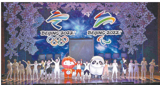
《冰墩墩与雪容融之冰雪梦》

一个冠军，也要拼尽全力去努力”的体育精神。 该剧将科技与童话结合，利用声光电的效果打造极具冰雪感和科技感的舞台，运用现代科技赋予演出未来感和时尚感。全剧以音乐剧形式表现，足足有9首不同的曲目、12个唱段，运用大量歌舞场面来表现冰上盛会的热闹欢腾；同时，强烈的打击乐贯穿演出始终，热情的演奏将体现冰雪梦的“燃”。