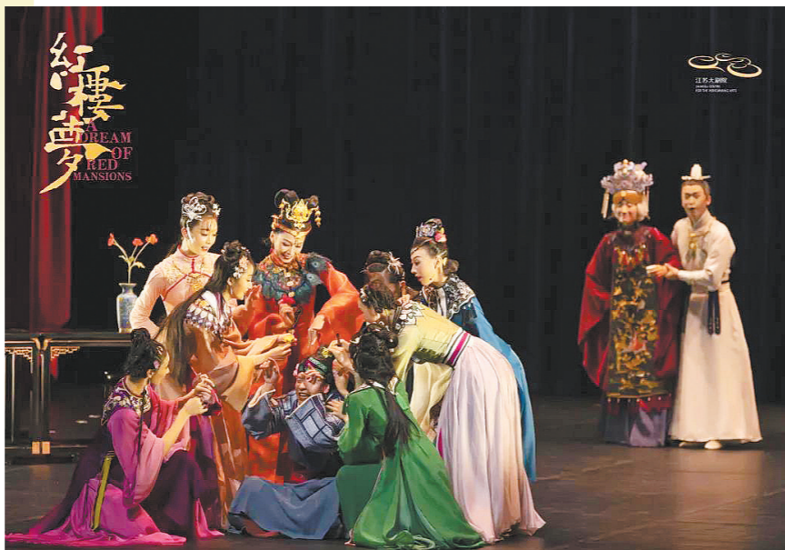
原创民族舞剧《红楼梦》

春日已至，万物复苏。本月中下旬至4月初，广州的演出市场也加快了回暖的步伐。在做好常态化疫情防控的情况下，各大演出剧院纷纷推出各式经典好剧、新剧，悬疑话剧、民族舞剧、古典音乐交响曲、爱情戏剧一齐登场。哪部能够抓住你的心？快来看看吧！