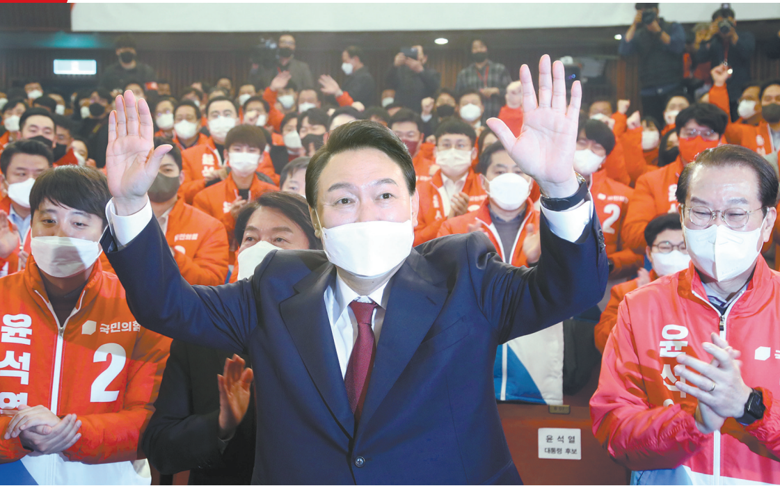
3月10日，韩国国民力量党候选人尹锡悦（前）在总统选举中获胜后挥手致意

在调查韩国前总统李明博贪腐案的过程中，尹锡悦也坐镇指挥，将李明博送入监狱。他以积极清算积弊，赢得了青瓦台的信任，一路获提拔到检察总长的位置。（中新）