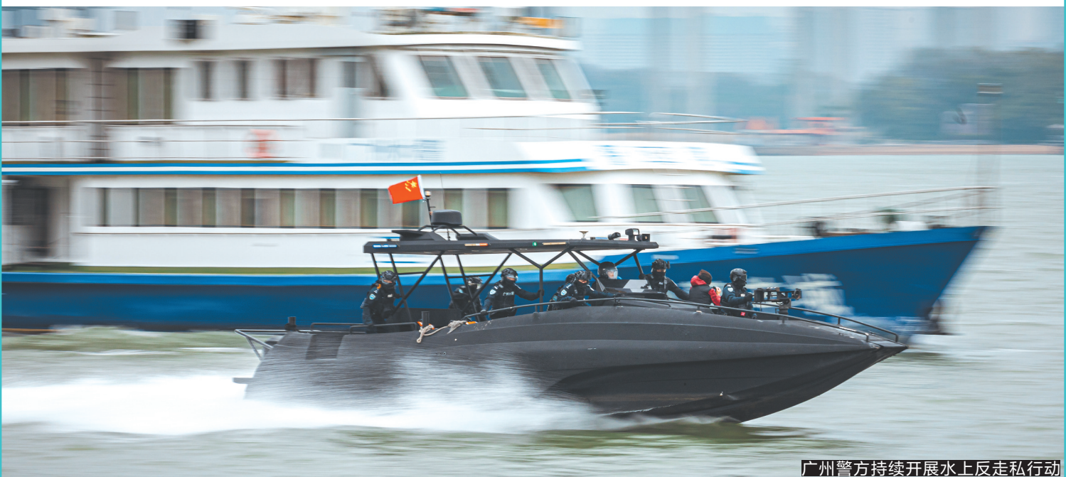
广州警方持续开展水上反走私行动

接报刑事警情同比下降13.3%，成功为群众拦截诈骗转账资金1.7亿元，查办各类走私案件16157宗案值逾168亿元，打掉涉黑组织1个、恶势力犯罪集团14个……3月17日，广州市公安局晒出2021年“成绩单”。记者了解到，2021年，广州警方不仅严厉打击电信网络诈骗、经济金融犯罪、毒品犯罪、走私犯罪等各类突出刑事犯罪，还全力开展社会治安整治、深化“放管服”改革等工作，着力提升人民群众的幸福感和安全感。