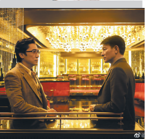
梁朝伟刘德华对峙