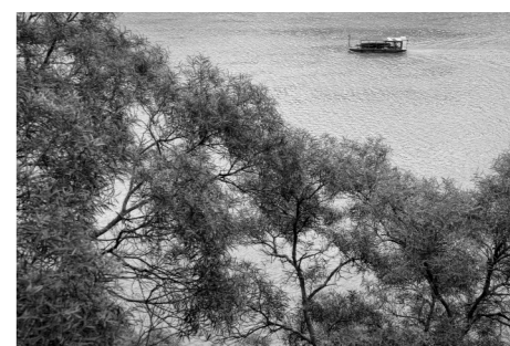
梧州市桂江流入西江，汇入珠江。江水往逝，舟楫翻过