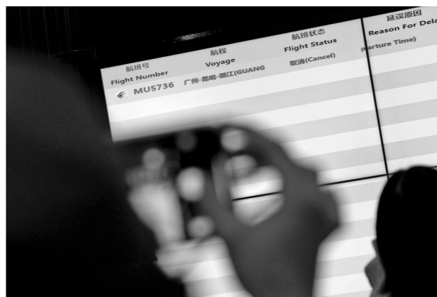
21日，受飞机失事影响，广州飞往昆明的航班取消