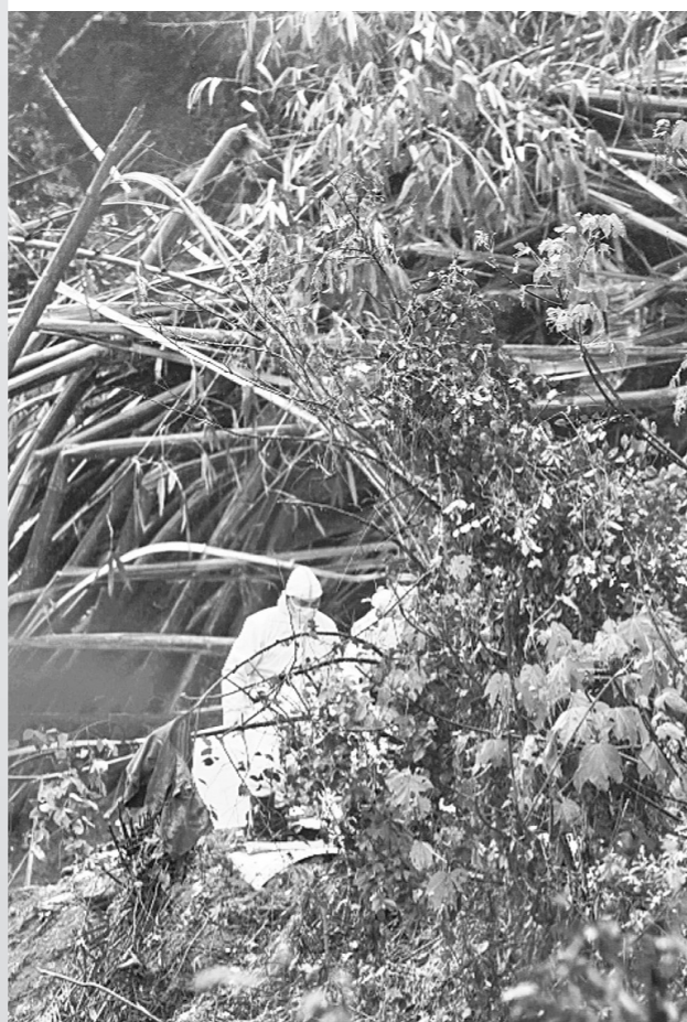
救援人员在草丛中艰难地搜寻遗物