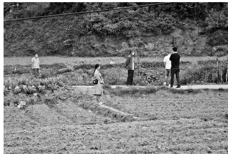
空难家属在等待进入空难核心区