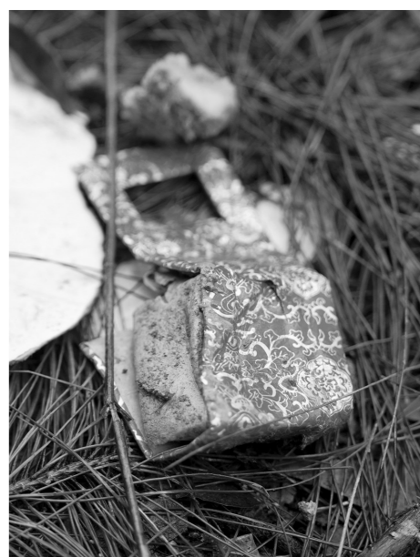
23日，“3·21”东航坠机事故核心区，疑似首饰包装盒的物品