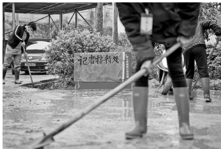
“记者接待处”设于指挥部门，牌子摆放在小学门口