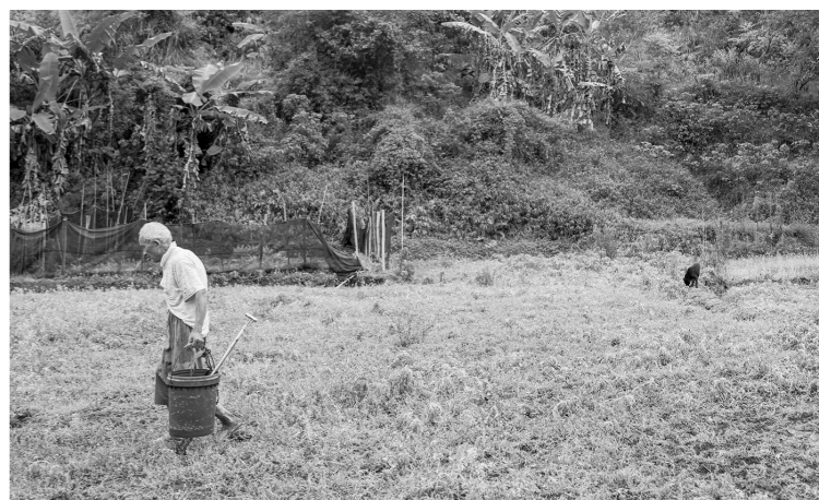
黄老伯在发现飞机残骸碎片的自家农田上，图中他身后约两米处，就是发现碎片的地方