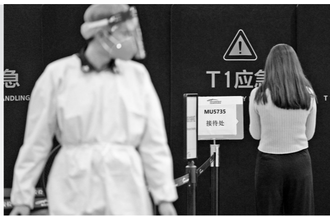
21日，广州白云机场T1航站楼设立家属临时接待区

路过梧州时，最后拍下了江水，与上面的小船。此江上通云南，下走广东，正是珠江的流域，这也是MU5735的路线。中国传统，灵魂可以随水而去，回到家里。