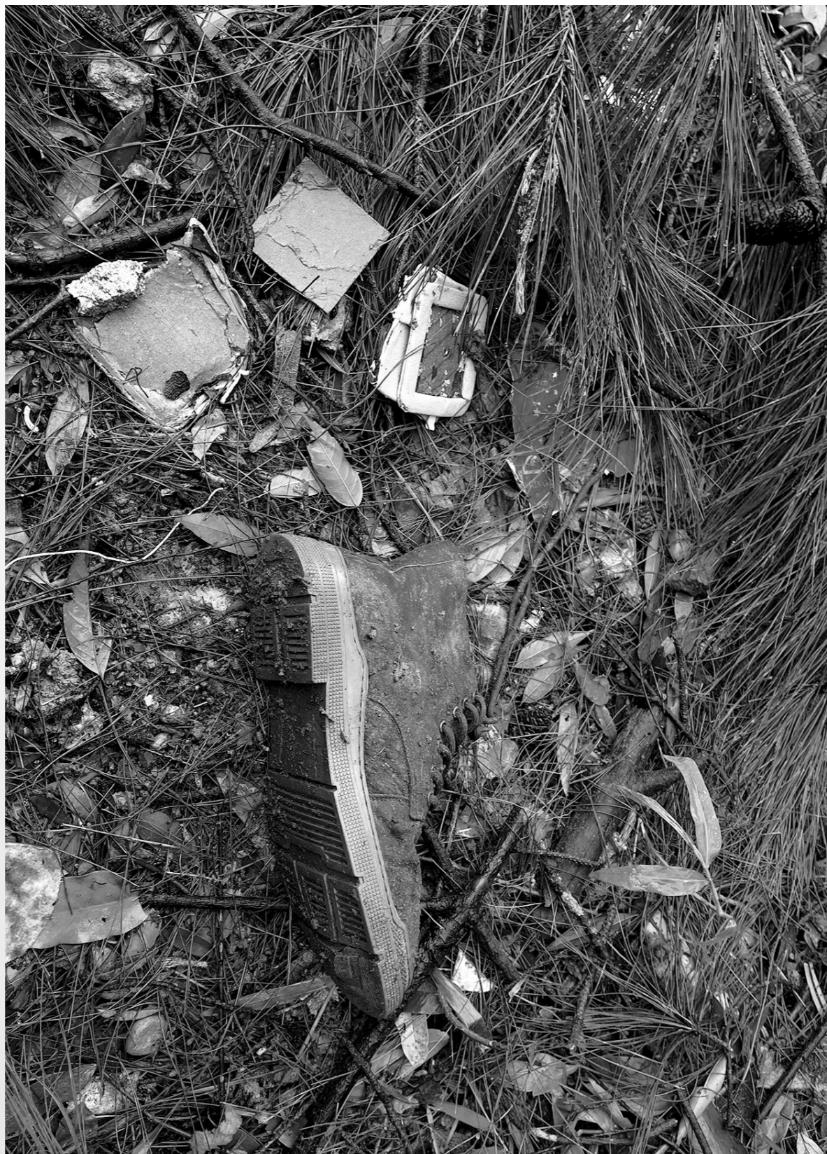
空难核心区域内，散落着飞机残骸和各种遗物