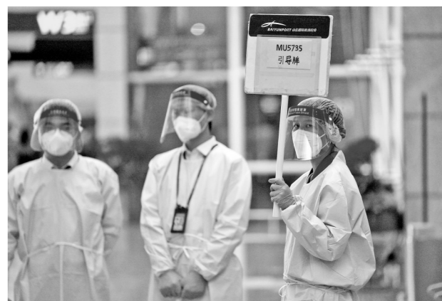
工作人员的神情代表着全国人民的感情