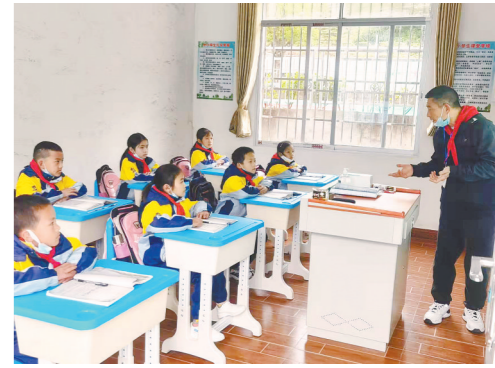
学生们在新课堂上上课

据介绍，教学点老师平均年龄已有45岁，许多老师都还记得，2000年左右大源镇学生人数最多时有六七百人，近几年则维持在四五十人的水平。现在国家和地方都鼓励进城，对此，老师们表示，“学生在哪里，我们就去哪里”。