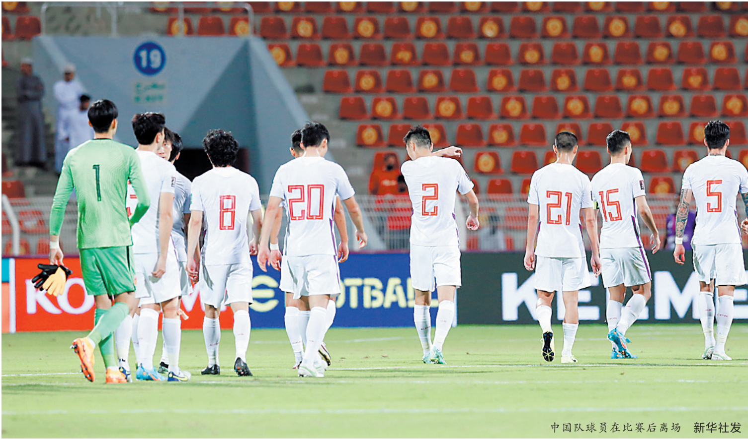
中国队球员在比赛后离场

羊城晚报讯 记者柴智报道:没有奇迹,也看不到希望!今天凌晨,在2022卡塔尔世界杯预选赛亚洲区12强赛最后一轮比赛中,中国男足客场以0比2完败于阿曼队,此次征程惨淡收官。