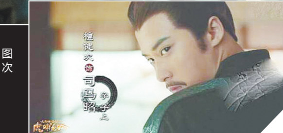
▲檀健次凭《军师联盟》获得观众肯定