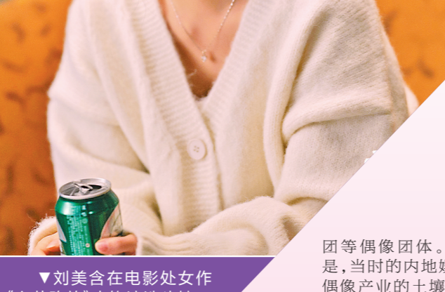
▲刘美含在电影处女作《心花路放》中饰演洗头妹