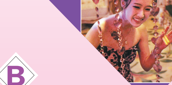
▲刘美含在电影处女作《心花路放》中饰演洗头妹