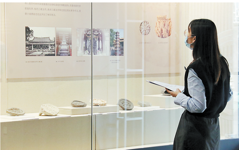
展览现场

近日,南越王博物院主办的《小瓦当 大世界——南越国宫署遗址出土瓦当专题展》正在该院王宫展区展出,共精选出100余件在遗址出土,从秦汉至明清时期的瓦当,展品涵盖了云纹瓦当、文字瓦当、兽面纹瓦当、莲花纹瓦当等种类。