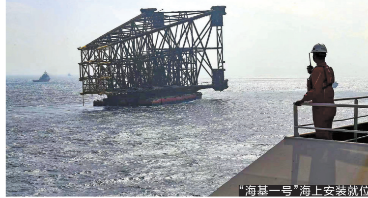
“海基一号”海上安装就位

羊城晚报讯 4月11日,中海油深圳分公司建造的亚洲第一深水导管架“海基一号”在陆丰油田海域成功滑移下水并精准就位,创造了亚洲深水导管架海上安装新纪录,标志着我国深水超大型导管架成套关键技术和安装能力达到世界一流水平,对推动海上油气增储上产、保障国家能源安全具有重要战略意义。