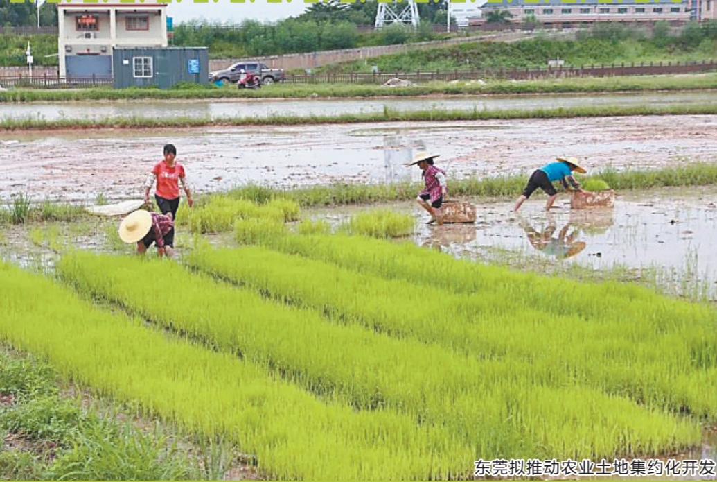
东莞拟推动农业土地集约化开发

4月11日,记者从东莞市农业农村局获悉,《东莞市农村土地经营权流转奖励实施细则(征求意见稿)》(下称意见稿)近日已对外发布。意见稿提出,为发展现代都市农业、集约利用耕地,东莞市财政拟设立土地流转奖励专项资金,对符合条件的土地流转双方实施奖励。目前,意见稿已走完对外征求公众意见程序。