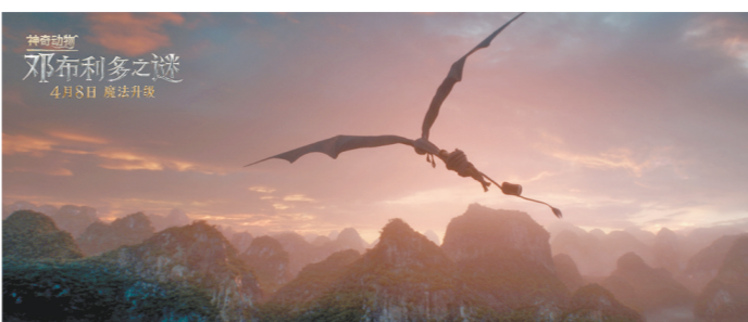
气翼鸟带着纽特飞行

看上去就像超脱于任何人类现实的“存在”。虽然并没有采用任何一种中国观众熟悉的麒麟长相，但这部最新的《神奇动物》中的神兽却似乎得到了多数观众的认可。羊城晚报全媒体记者观察豆瓣、淘票票和猫眼等平台的观众评价，发现虽然大家对这一部《神奇动物》褒贬不一，却鲜有人对麒麟的外形表示不满。