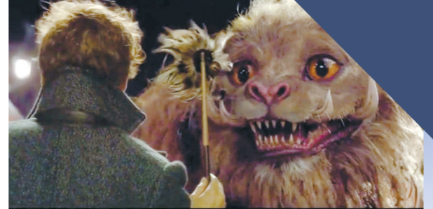
上一部中纽特用逗猫棒收服了驭吾