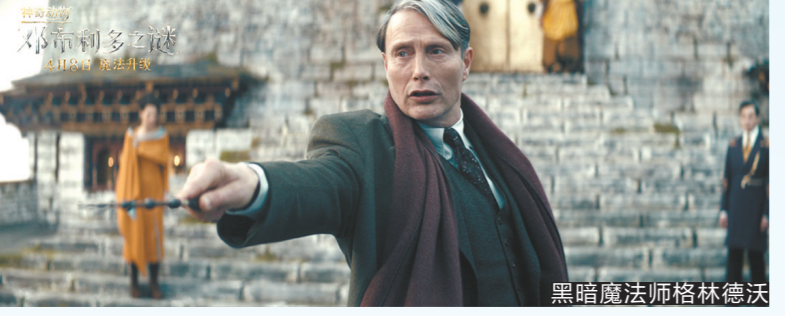
黑暗魔法师格林德沃

从7.7分到7.0分到6.3分，J.K.罗琳的魔法新世界《神奇动物》系列在豆瓣口碑上走起了下坡路。近一半的观众为这部最新的《神奇动物：邓布利多之谜》打了三星，有人评价“看不懂”“神奇动物太少”“希望下一部换导演”。