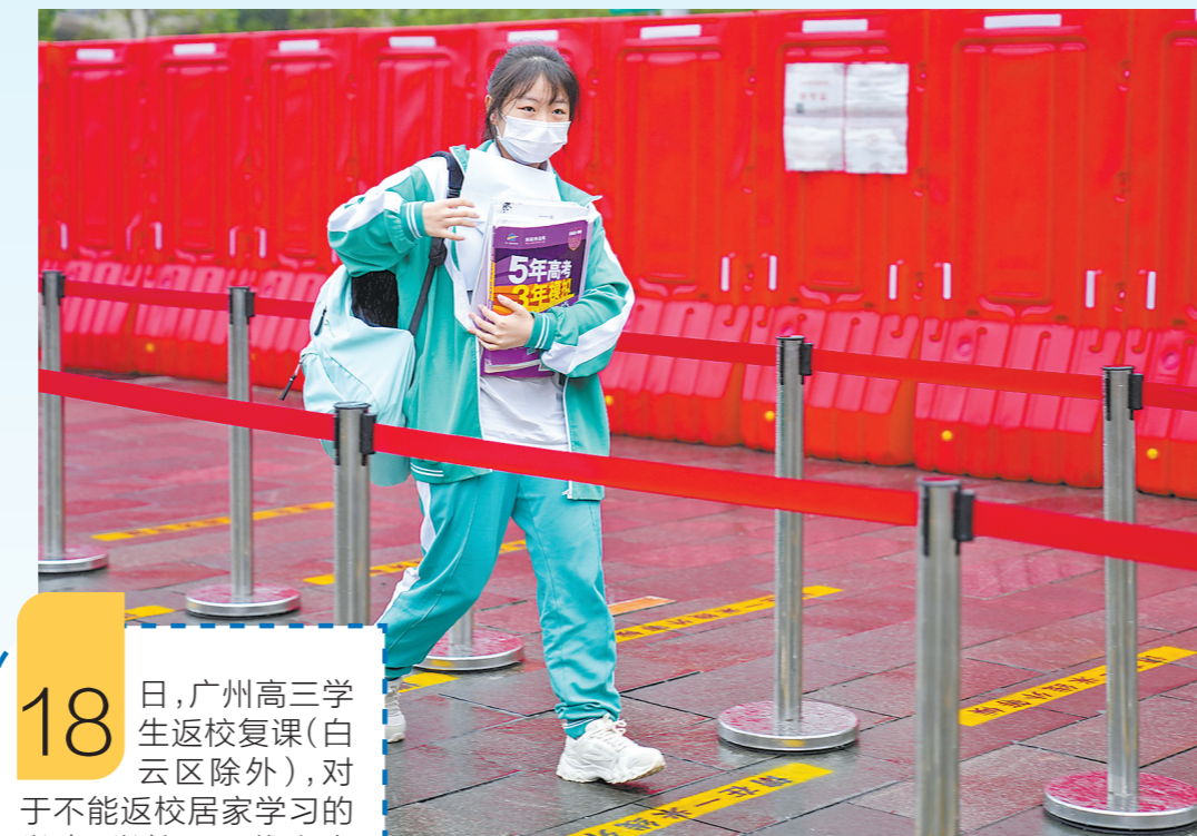
18日,广州市第一一三中学高三学生返校

18日,广州高三学生返校复课(白云区除外),对于不能返校居家学习的学生,学校采用线上方式同步推送教学内容。记者走访多所学校了解到,各校严格执行相关防疫要求,在守好学校安全门的同时,将调整高三备考复习节奏,做好后期应急预案。