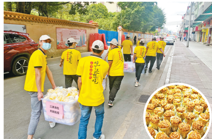
白云一家包子铺已免费送出超2000份爱心早餐

“纯肉包子多加馅,蛋糕多加鸡蛋和牛奶,豆奶必须热乎……”连日来,广州白云区云城街管控区内一家汤包连锁店的负责人多次叮嘱店内员工,“只要他们能吃上一口热乎的早餐,我们几点起来都不要紧。” 4月15日以来,这家包子铺每天早上7时30分,都会准时把热腾腾的早餐送到云城街党群服务中心,供抗疫工作人员免费享用。几天下来,该包子铺已送出超过2000份、价值两万多元的爱心早餐。