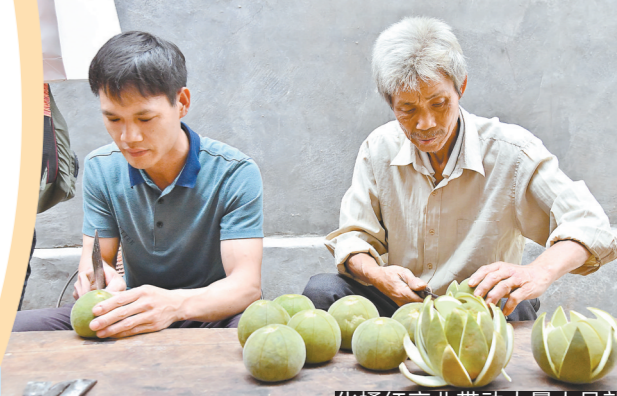
化橘红产业带动大量人员就业

穿越历史云烟,作为岭南农业大市之一的茂名,历经百年风雨洗礼,积累了深厚的底蕴。近年来,茂名坚持“农业优势不能丢”,推动农业由“大”向“强”转型发展,成为全省首个农业总产值超千亿元的地级市。今年,茂名农业以“五棵树一条鱼一桌菜”为抓手(“五棵树”为荔枝、龙眼、沉香、化橘红、三华李,“一条鱼”即罗非鱼,“一桌菜”即预制菜产业),构建现代农业产业体系,推动茂名农业优质高效发展,持续做大做强。茂名将从农业加工、品牌创建、产品出口等方面给予扶持,培育百亿现代农业产业集群,让现代农业成为茂名的靓丽名片。