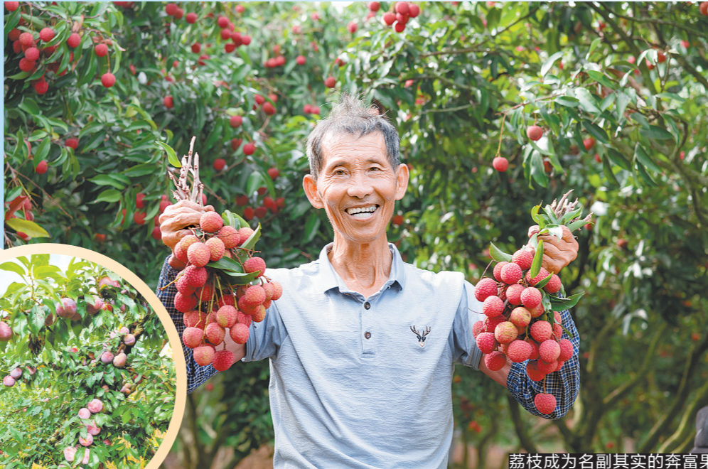
荔枝成为名副其实的致富果

近年来,茂名“中国罗非鱼之都”这块招牌熠熠生辉,全市罗非鱼养殖约26万亩,产量23.56万吨,约占全省罗非鱼总产量1/3,综合总产值74.9亿元。茂名罗非鱼远销国外49个国家和地区,其中主要出口对象为墨西哥、美国及非洲等地,出口罗非鱼总量稳居全国前列。数年来,茂名预制菜产业打下雄厚基础。茂名市拥有规模以上预制菜加工企业33家,年产量约11.85万吨,年产值约34亿元。