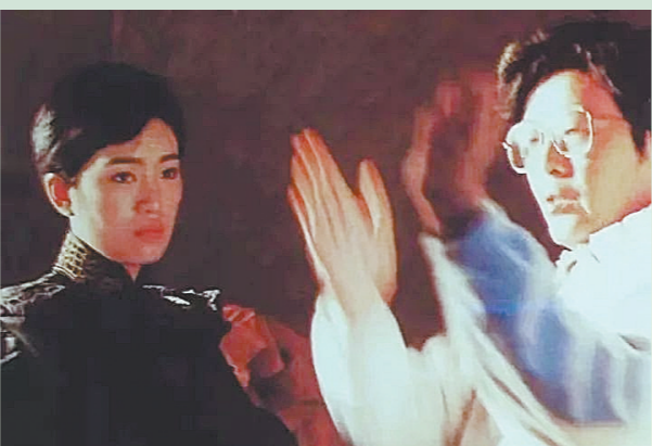
黄蜀芹拍电影《画魂》时给巩俐讲戏