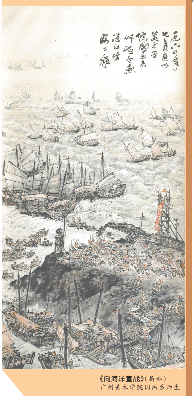
《向海洋宣战》(局部) 广州美术学院国画系师生

主办方表示,最近十几年来,广州美术学院中国画学院在学科规划、课程建设和教学方法上都进行了大幅度改革和创新实践,通过不断回溯自身的教学历史,广泛吸收兄弟院系的经验,在开放的前提下深化岭南画学,巩固这一旗帜下教学内容所涵盖的造型基础、专业基础、理论基础和创作基础,集中体现出传统底蕴与当代意识的结合,专业技能与社会实践的并重。