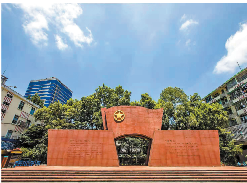
广州东园旧址附近的“团一大”纪念广场