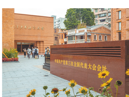
中共三大会址纪念馆

民族舞剧《醒狮美高梅》仅是广东文旅对外交流的小小案例。近年来,广东加大对外交流,持续扩大文旅的“朋友圈”。其中,深入打造“广东文化精品丝路”品牌,举办东盟、太平洋岛国等广东文化周活动,组织赴30多个国家和地区参加“欢乐春节”、中国-东盟旅游年等活动,国际影响力进一步扩大。2020年,广东制定《落实〈粤港澳大湾区发展规划纲要〉三年行动计划》,结合疫情防控要求,开展了70余场粤港澳大湾区文化交流活动,举办粤港澳大湾区艺术精品巡演、粤港澳大湾区青年文化之旅、台湾青年岭南行等活动,推出5个主题的27条广东省粤港澳大湾区文化文化遗产游径;成立粤港澳大湾区(广东)文创联盟并举办文创设计大赛,江门仓东文化遗产游学营入选国家“港澳青少年内地游学