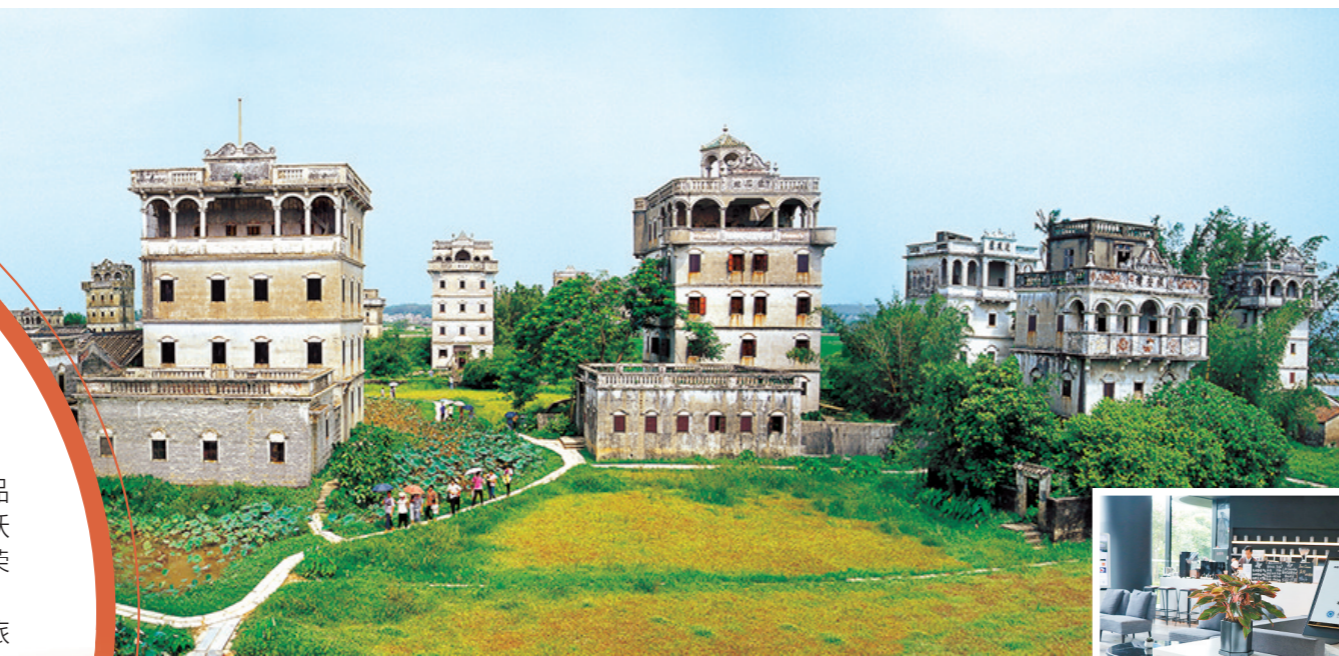
开平自力村碉楼群