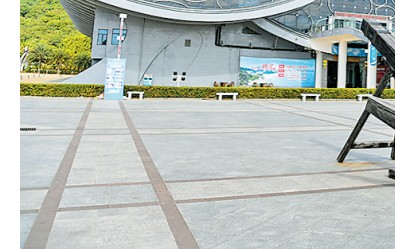
广东海上丝绸之路博物馆

目前,广东全省共建成县级以上公共图书馆150家、博物馆366家、乡镇(街道)综合文化站1614个、行政村(社区)综合性文化服务中心25000多个,公共文化基础设施基本实现省、市、县、镇、村五级全覆盖。全省涌现“粤书吧”、智慧书房、读书驿站等2000多家新型阅读空间,公共文化设施网络进一步织密。公共图书馆总藏量等多项指标位居全国首位,广州图书馆连续6年基础服务量居全国第一。省财政投资23亿元,总建筑面积达14.45万平方米的“三馆合一”省级标志性文化工程开工建设,该项目主体结构已于近日封顶。中山市基层综合性文化服务中心“三三三”工作模式被文化和旅游部向全国推广。