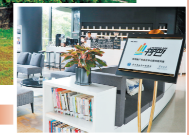
广州南沙花园酒店粤书吧