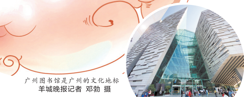
广州图书馆是广州的文化地标

广东省十二次党代会以来,广东文旅部门推进文旅强省建设,守护传承岭南文脉,打造粤港澳大湾区世界级旅游目的地,绘就了令人振奋的“文旅秋收图”,南粤大地上“诗和远方”越来越美。