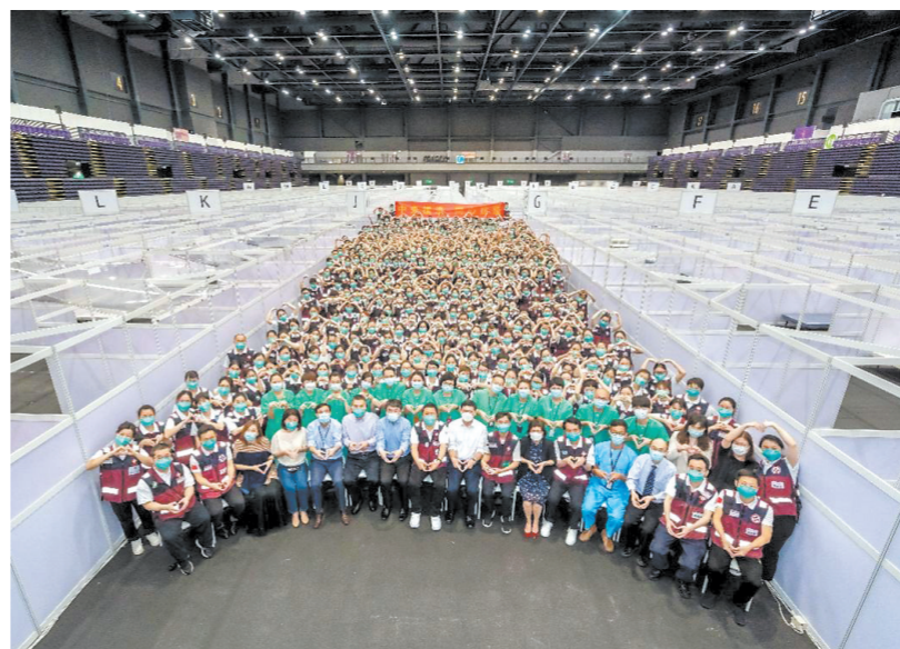
香港亚博馆新冠救治中心舱备用，内地医疗队合影

从2020年1月24日除夕夜驰援武汉，2021年5月广州“正面刚”德尔塔，到2022年赴香港迎战奥密克戎，张忠德的12次出征抗疫，见证了中西医深度融合的抗疫方案越来越成熟。