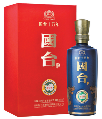
国台核心战略产品国台十五年

据悉，下一步，国台还要依靠信息支撑、数字集成、智能分析，把智能酿造推进到新阶段，从而实现国台从传统产业转型为新型工业化的企业，闯出一条新路，为酱香白酒智能酿造规模化建设打好基础。