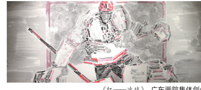
《红——冰球》 广东画院集体创作

态，进一步提升了画院的社会认知度和业界影响力。2020年12月19日，作为省级七项重大标志性文化工程项目，广东画院新址正式启用，举办了“广东画院（新址）启用暨优秀作品展”开幕式。广东省委书记李希、时任省长马兴瑞为广东画院（新址）启用揭幕，参观画院优秀作品展，并会见参加活动的王玉珏、刘斯奋、许钦松、李劲堃、林蓝、冯少协等艺术家代表。李希、马兴瑞代表省委、省政府对广东画院（新址）启用表示祝贺，充分肯定广大艺术家、文艺工作者为广东文化事业发展作出的积极贡献。省领导张硕辅、林克庆、张福海参加活动。广东画院（新址）的落成启用，得到全国艺术界的关注和支持，中国美术家协会、中国国家画院、北京画院、江苏国画院等分别发来了贺信。