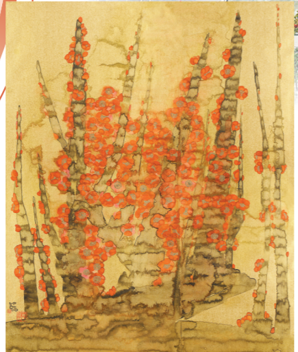
《梅坚如铁·武汉·2020》 林蓝