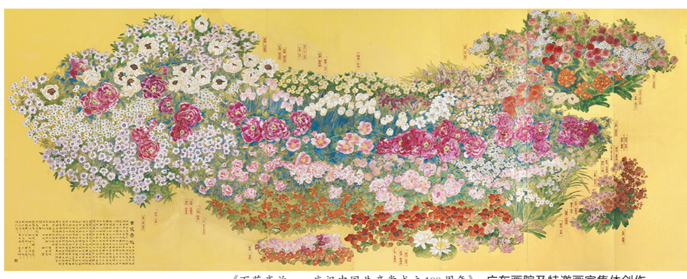
《百花齐放——庆祝中国共产党成立100周年》 广东画院及特邀画家集体创作