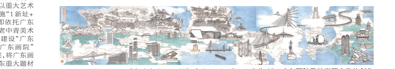
《南国的风——深圳、珠海、汕头、厦门经济特区》 广东画院及特邀画家集体创作