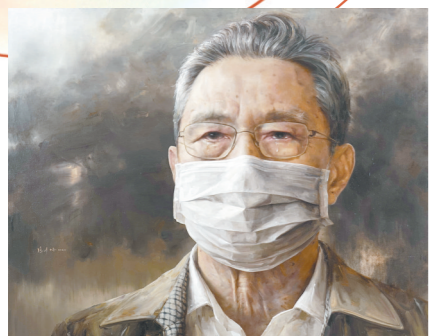
《中国共产党党员——钟南山》 冯少协