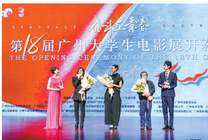
广州大学生电影展真正由大学生唱主角

作为“广东电影人之家”,省影协还举办“法律与电影人面对面”暨影视版权若干法律问题交流会;为会员电影故事片《军魂》举办剧本研讨会;为会员电影作品《柳卯》《太阳升起的时候》《中学时代》《踢球吧,阿妹》《追梦征途》《小伟》《烈焰危情》《一级指控》《安宇》《非常直播》《我的体育老师》《毕业第一年》等组织影片观摩研讨交流活动;组织举办2021年广东省电影家协会春季电影交流暨2020年优秀抗疫情作品颁奖礼,营造广东电影界团结向上、和谐发展的良好氛围。