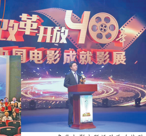
各类电影主题活动反响热烈

过去五年,广东省电影家协会广泛地团结与服务广东电影人才,引导广大电影工作者践行以人民为中心的创作导向,用高质量电影作品生动地讲好中国故事、粤港澳大湾区故事、广东故事,彰显“原创广东”力量,助推广东电影走高质量发展之路。