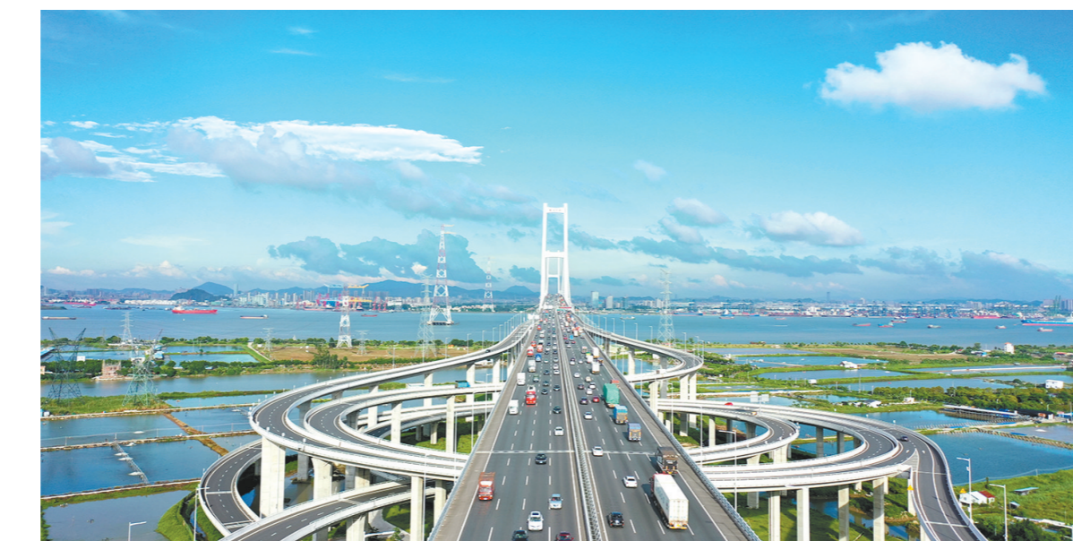
南沙大桥是全国首个5G覆盖特大桥，利用5G的传播速率快时延低的特点，南环段分公司引入无人机技术，成立“海空巡控”小分队，3名路政员获得了UTC无人机巡检证，4名路政员获得了AOPA无人机驾驶证，累计执行各类飞行任务600余次，对监控调度、路况上传、快捷取证、实时反馈等方面发挥了良好作用。目前，南环段及南沙大桥是广东省12个无人机应用支撑节假日智慧出行重点路段之一。

南沙大桥是全国首个5G覆盖特大桥，利用5G的传播速率快时延低的特点，南环段分公司引入无人机技术，成立“海空巡控”小分队，3名路政员获得了UTC无人机巡检证，4名路政员获得了AOPA无人机驾驶证，累计执行各类飞行任务600余次，对监控调度、路况上传、快捷取证、实时反馈等方面发挥了良好作用。目前，南环段及南沙大桥是广东省12个无人机应用支撑节假日智慧出行重点路段之一。南环段分公司引入智慧监控“路运一体化平台”，实现监控画面可视化操作和预警，使决策更科学、管理更高效、信息更顺畅，提高了资源调度效率和突发事件处置效率。在此基础上，南环段分公司研发的“高速公路事件检测系统”，实现了对路面异常车辆、行人、非机动车的自动化、高效化检测，确保异常事件的快速发现和介入处置。据统计，“高速公路事件检测