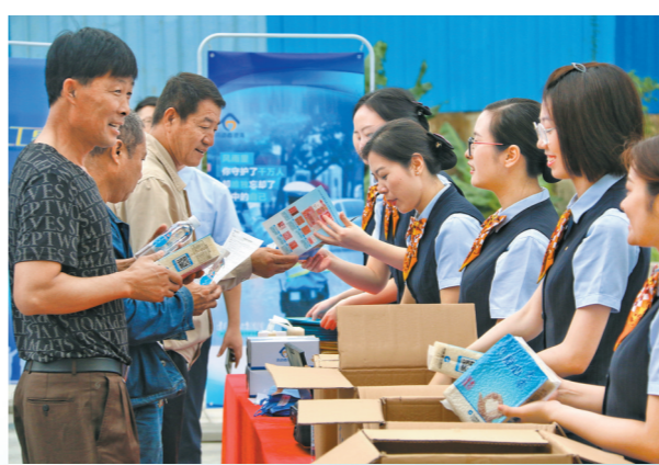
建行金融服务大湾区交通枢纽升级，图为广东中山分行为修建深中通道的工作者送上爱心大米

大数据应用，在金融产品和服务创新上笔耕不辍，首家应用区块链技术实现电子发票在线开立，应用3D数字技术搭建“广交数数字银行”，行业首创基于互联网交易提供平台类资金管理综合解决方案“龙存管”等，为各类生活场景的便捷触达量身打造建行方案。而与省政务服务数据管理局联合推动“百项政务服务进网点”活动以来，建行网点已然成为了百姓身边的办事大厅。值得一提的是，建行广东省分行在系统内率先推出“民工惠”普惠性服务，依托特色工具将企业融资款项直接支付至农民工个人银行卡，保障工人工资精准到账，截至3月末，累计为230.7万人次建筑工人融资发放工资177.96亿元，将应发工资变为专项融资，切实解决进城务工人员的“发薪”问题。