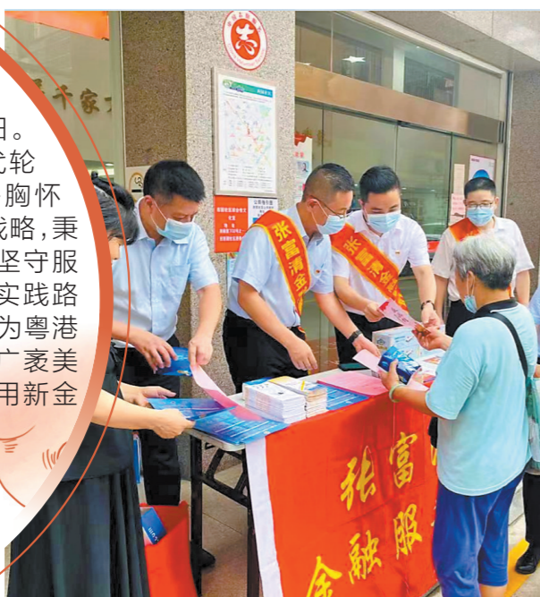
建行广东江门分行在“学习张富清日”组织党员干部前往社区、公园宣传金融知识

珠江潮起、南粤春回。从城市到乡村，从生产到生活，金融的服务底色在发展年中温润如旧。在建设人民美好生活的时代轮廓下，建行广东省分行始终胸怀“两个大局”，主动融入国家战略，秉承“国之大者”的责任情怀，坚守服务实体经济初心，在新金融实践路上予企业解难，予民生反哺，为粤港澳大湾区经济高质量发展、广袤美丽乡村建设写下壮丽诗篇，用新金融行动积极回应人民对美好生活的向往。