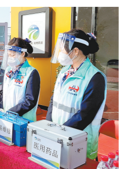
假日期间，路政、监控岗位全员在岗，路面实行“驻点+轮巡+补位+快处”巡控模式，根据路面情况及调度指令进行“圆环式”轮巡补位；启用南沙大桥“路网监控前置点”，重点监测南沙大桥及周边路网的运行情况，提高路面事故见警率和到场速度。

南环段分公司沿线设置了丹灶、杏坛以及海涌岛三个便民服务区，近年重大节假日期间，党员、团员志愿者深入站场、服务区，提供饮水、简易维修、路线指引、应急药品、粤通卡办理等服务。2019年，南环段分公司“004”收费团队获评第六届“最美中国路团队”；2021年，丹灶中心站被评为“全国青年文明号”。今年五一期间，南环段分公司继续组织党员、团员志愿者开展清扫卫生、引导车辆停放、巩固“厕所革命”成果，用实际行动践行“为人民服务”宗旨，切实为群众办实事、办好事、解难事。使命在肩，初心如磐。未来5年，深中通道、黄茅海跨江通道、狮子洋通道等世界级工程相继建成，大湾区交通网络将不断完善。广东交通建设将继续稳步发展，助推广东在全面建设社会主义现代化国家新征程中走在全国前列、创造新的辉煌。