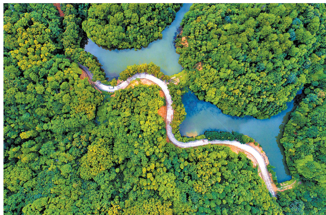
高明区云勇森林公园

近日发布的《佛山市高明区文化旅游发展“十四五”规划》指出,高明将打造成为“高综合竞争力、高品质生活内涵、高城乡民生福利、低生态资源损耗率”的高质量发展典范,实现从旅游大区向旅游强区跨越,开创文化旅游发展新局面。