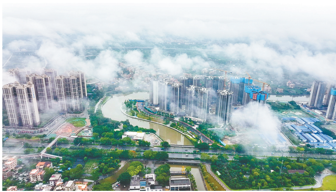
顺德实施以水兴城战略,城市环境不断改善