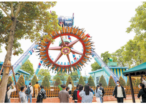
盈香生态园里的机动游戏受市民欢迎