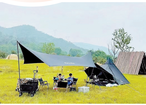
农场部落是一个亲子活动的好地方

在“旅游兴区”发展战略的推动下,高明的旅游产品供给日益丰富,营销力度不断加大,治理能力提升。“十三五”期间,2021年高明区旅游总收入和接待游客数量相比2015年分别增长105.9%、104.5%。