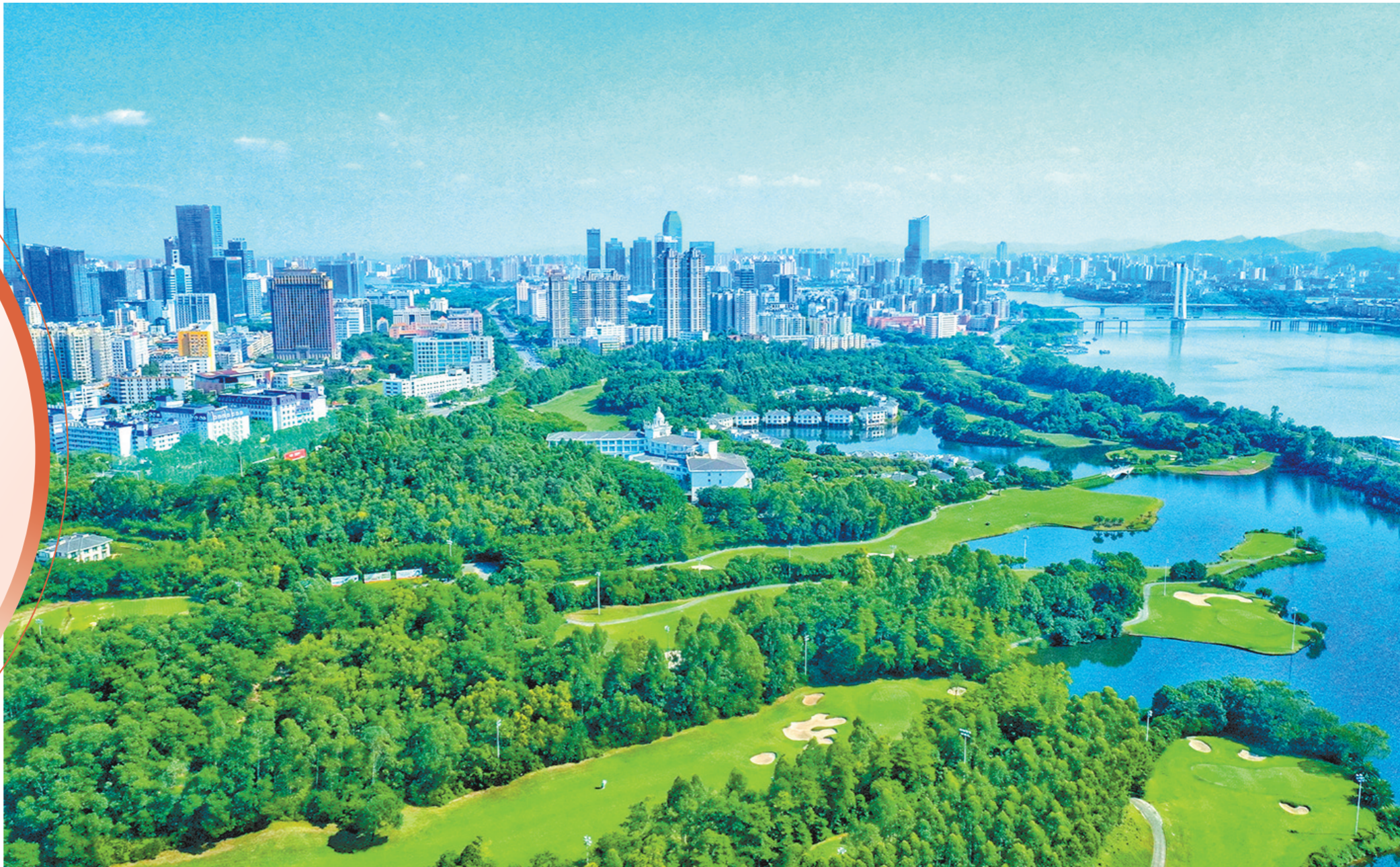
水清岸绿的惠州城

去年11月,惠州市第十二次党代会描绘了今后五年发展蓝图,提出要打造粤港澳大湾区高质量发展重要地区,为广东继续走在全国前列、创造新的辉煌作出重要贡献。今年第一季度经济成绩单恰恰印证了惠州的决心与担当,充分展现了在全省“双统筹 双胜利”中的惠州力量。