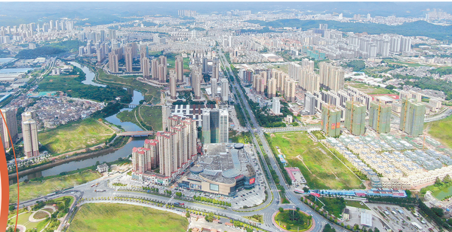
台山市台城

在“快车道”中如何跑出加速度？中共台山市委十四届四次全会提出，聚焦新旧动能转换，大力实施“科技引领”工程；大力发展实体经济，深入推进“工业振兴”工程；高效推动组团建