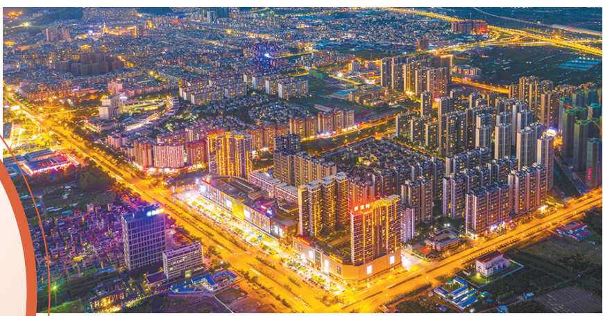
新会区枢纽新城夜景

国内新能源汽车龙头企业之一落户、全区固定资产投资同比增长11.3%……今年一季度，江门市新会区经济运行实现“开门稳”，为该区全年工作稳步推进打下坚实基础。