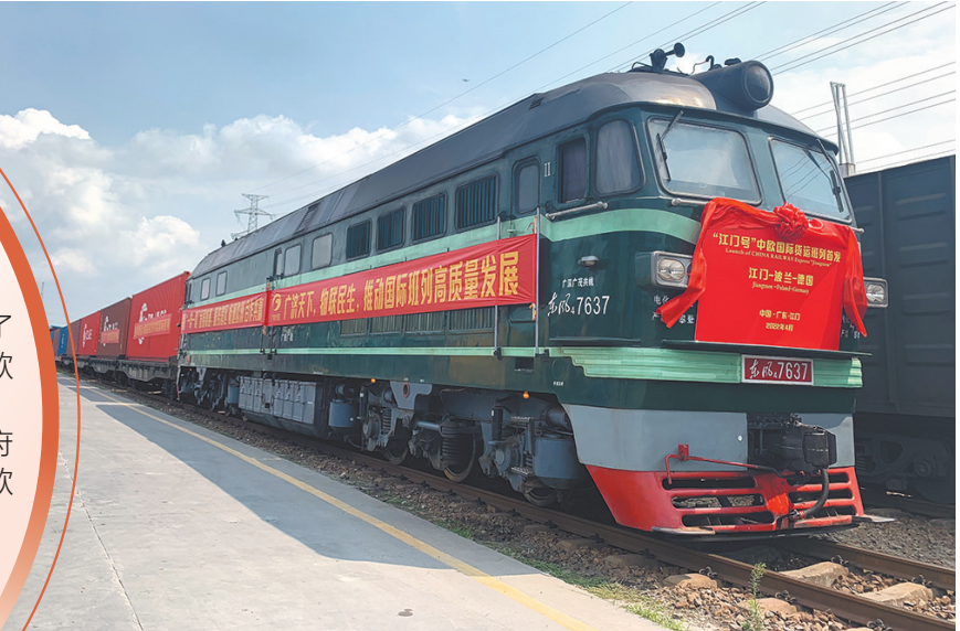
今年4月底，“江门号”中欧班列从鹤山发出

英国人品尝的红茶、德国家庭厨房中的面包机、奥地利运动员使用的头盔……近年来，江门鹤山企业生产的各类产品“卖”遍欧洲。随着4月28日珠海和粤西首趟中欧班列从鹤山开出，当地企业更实现了“从‘家门口’到欧洲市场”，鹤山中欧合作迈入新阶段。