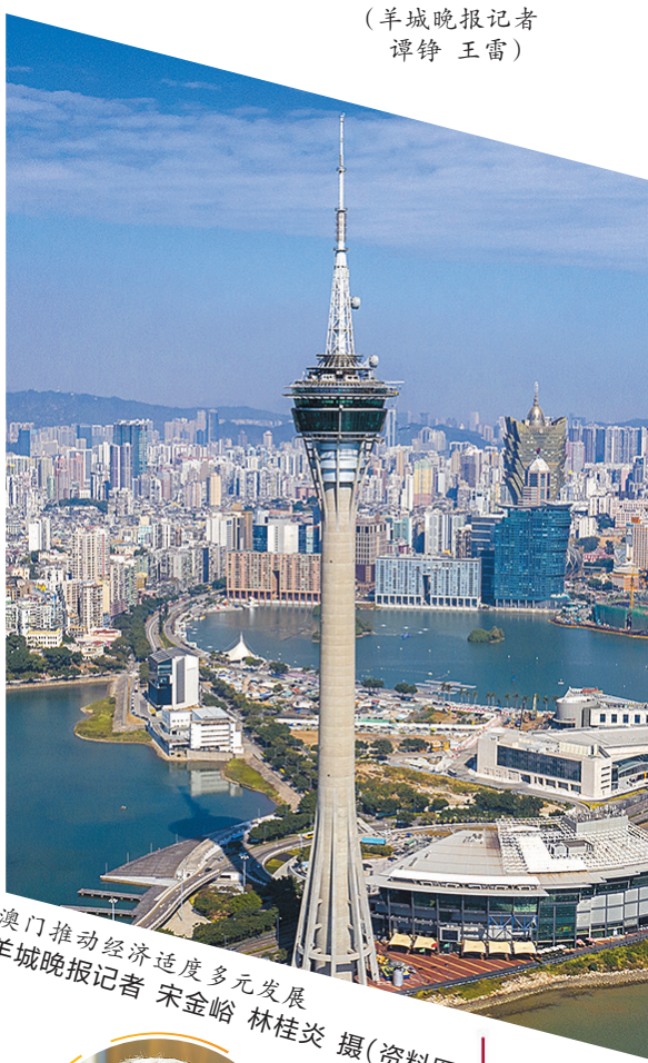
澳门推动经济适度多元发展。羊城晚报记者 宋金峪 林桂炎 摄（资料图）