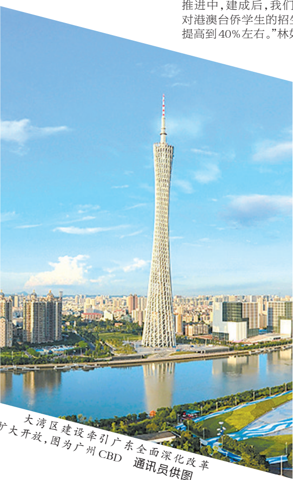
大湾区建设牵引广东全面深化改革扩大开放。图为广州CBD。