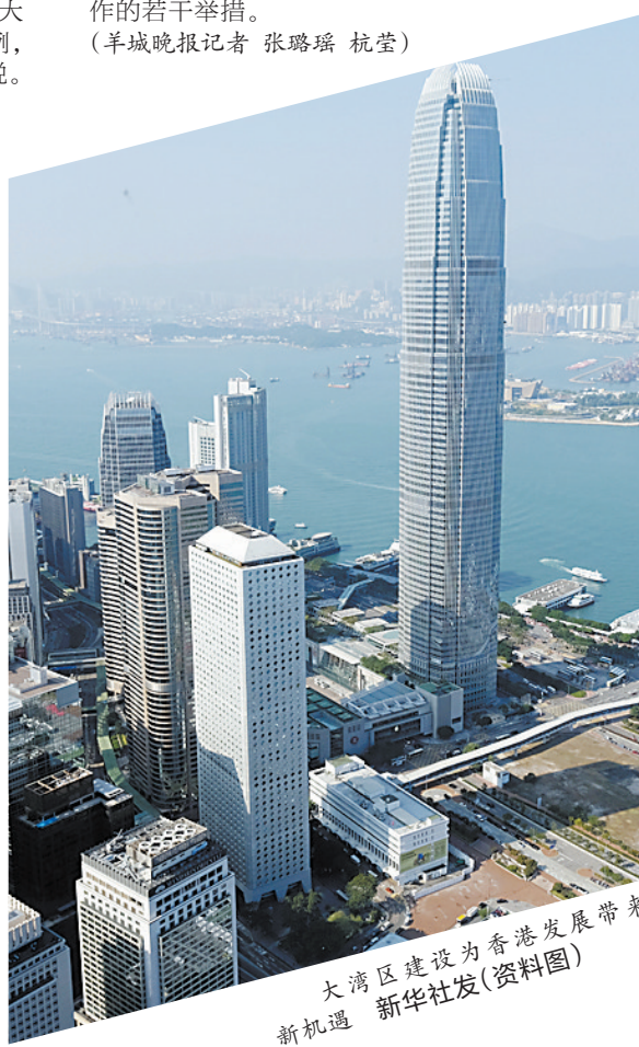
大湾区建设为香港发展带来新机遇。（资料图）