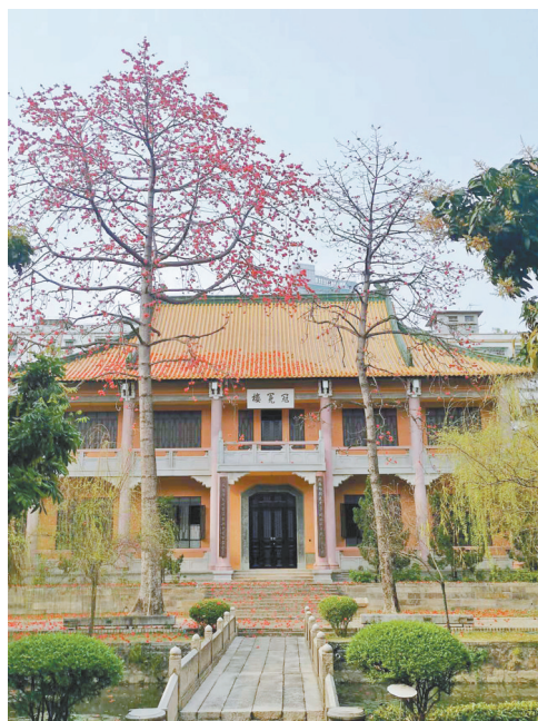
▲ 广雅本部冠冕楼 ▼ 广雅花都校区冠冕楼