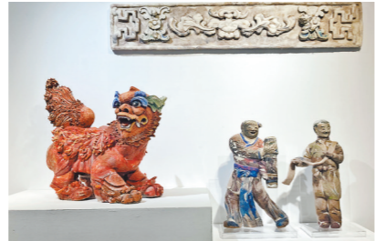
用纤维还原灰塑，探寻非遗传承发展新可能

近年来，岭南文化创造性转化和创新性发展日益成为年轻学子的设计自觉，他们以包容性设计、可持续设计在传统文化、生活美学上推陈出新。