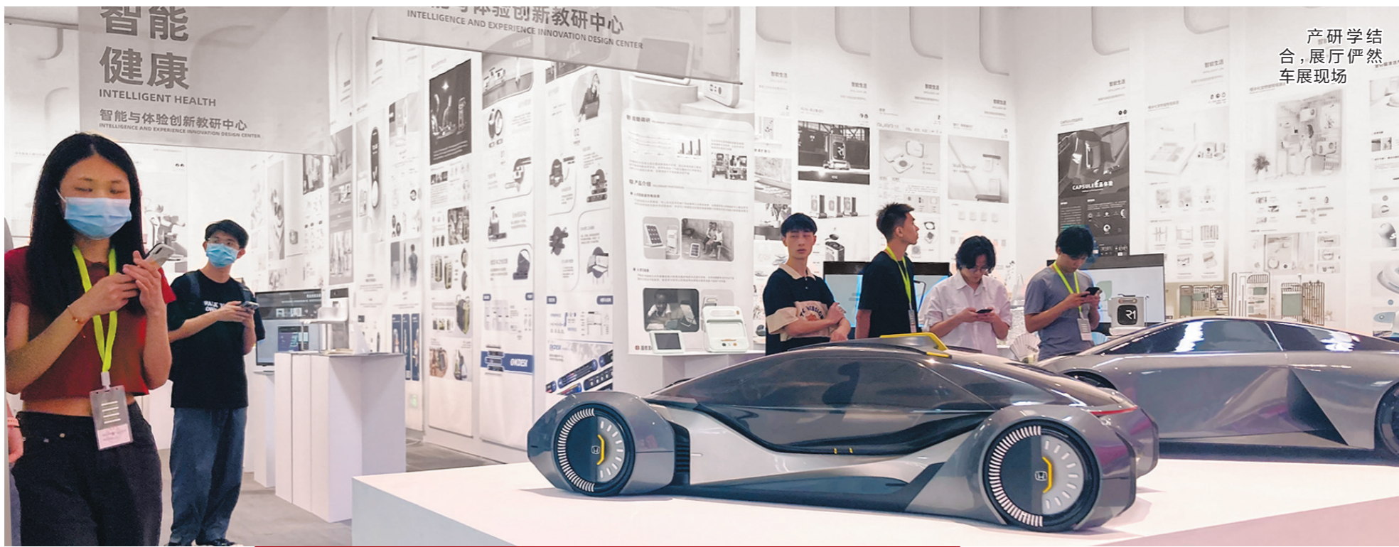
产学研结合，展厅俨然车展现场

他在《广东新语》里写道，从广东之内其实可以看到广东之外。他心目中的岭南文化，不是“岭南的文化”，而是在岭南成长起来的，与中原息息相关的文化形态，有着丰厚的中华文化基因。这是一种很纵深的历史感，是非常了不起的。那么，屈大均的文学史定位