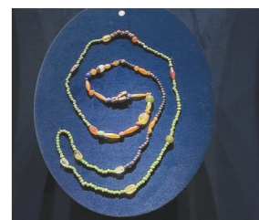
琥珀玛瑙红玉髓水晶玉玻璃串珠

广州考古出土两汉时期珠饰两万余颗，它们材质丰富、形制多样、色彩斑斓，且来源广泛，见证了岭南与周边地区，特别是与东南亚、南亚、西亚及地中海沿岸地区通过海路进行的贸易往来和人文交流，为人们重现了汉代番禺“珍奇荟萃、商业繁华”的生动历史画卷。