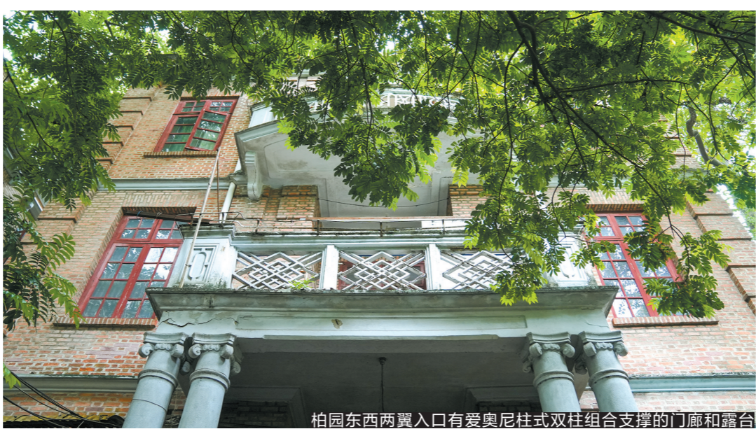
柏园东西两翼入口有爱奥尼柱式双柱组合支撑的门廊和露台

1928年10月22日,历史语言研究所在柏园正式成立。《顾颉刚日记》中记述,事出匆忙,史语所一开始连个招牌都没有。