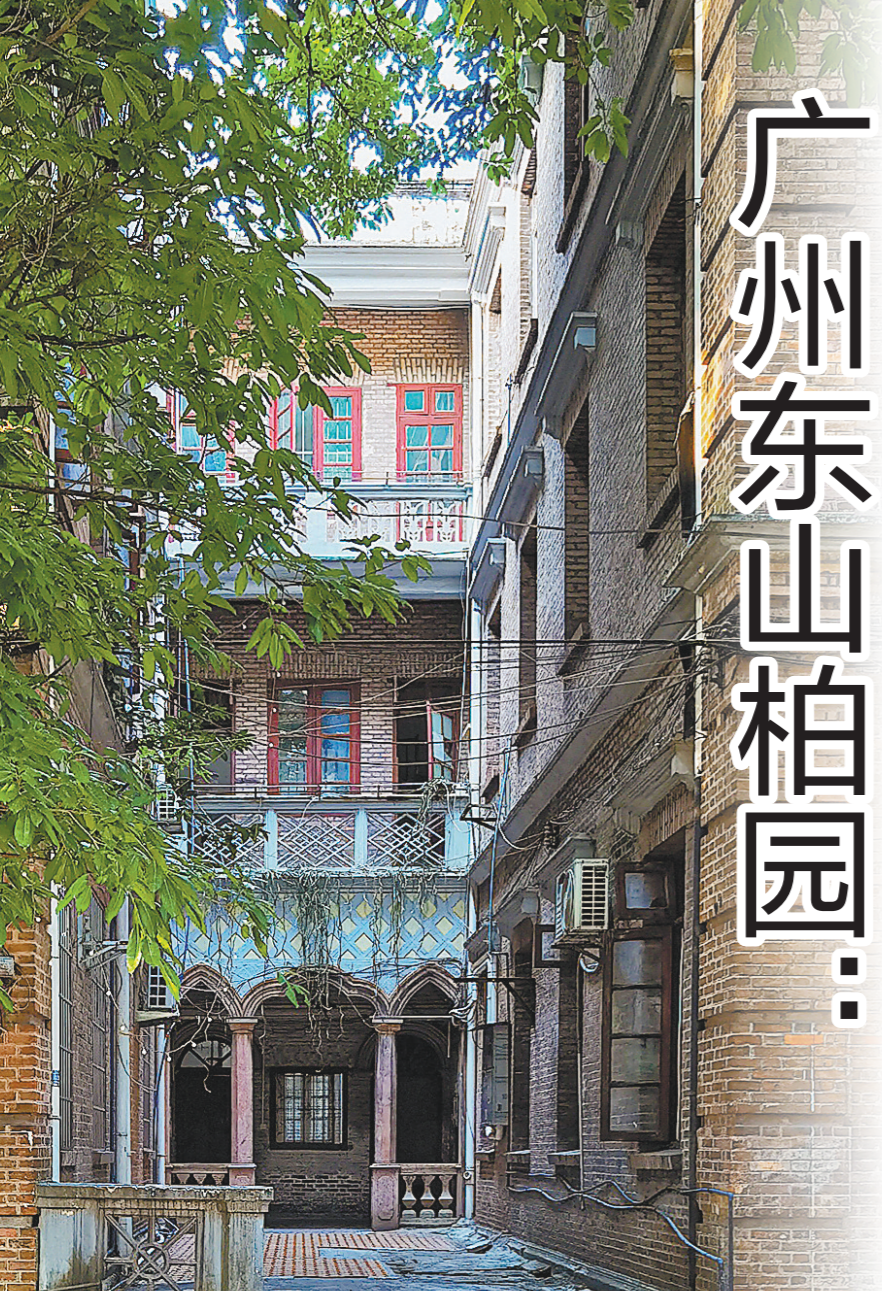
柏园一瞥

文/羊城晚报记者 朱绍杰 邓琼 文艺 通讯员 任海虹