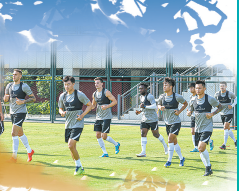
升班马梅州客家队加强训练