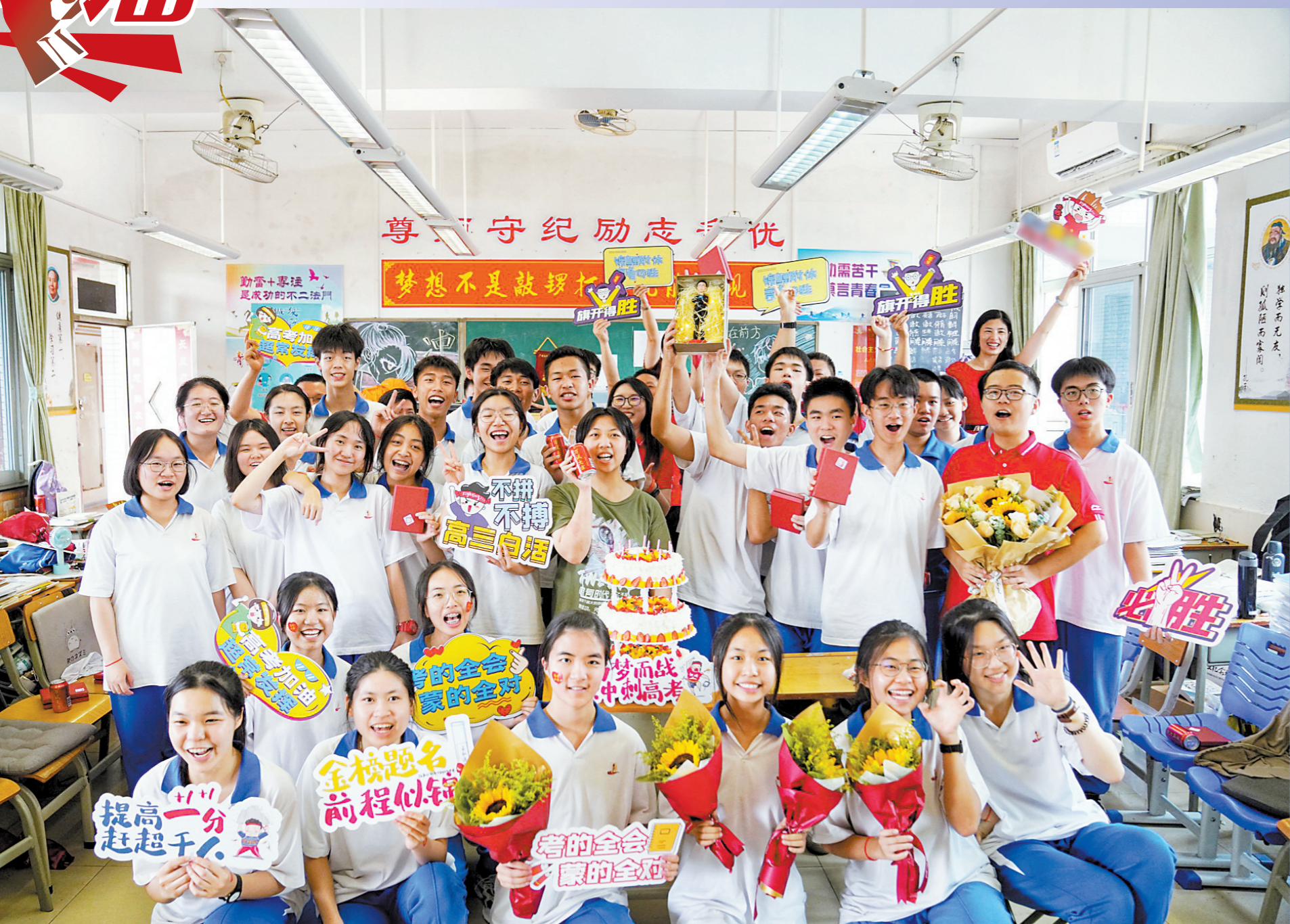
高考前一天，广州大学附属中学高三年级迎来最后一课。师生们回望过往、展望未来，为高考加油打气