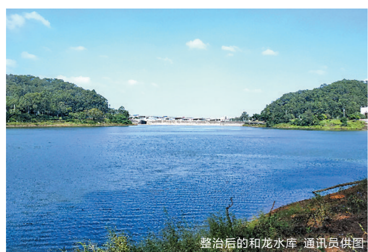
整治后的和龙水库

建设社区慈善(志愿服务)工作站有关工作经费纳入市、区两级财政预算,发动社会力量对社区慈善(志愿服务)工作站给予资金支持,对每个站点资助启动资金,年底对符合条件的示范性社区慈善(志愿服务)工作站进行资助。