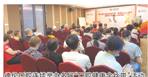
德伦口腔连续举办多届“口腔健康金腰带”活动

为进一步提升世界卫生组织“8020计划”,提高市民生活质量,推进“粤口腔健康”建设,现在进口种植牙980元起/首颗,单颗缺牙、多颗缺牙、全口无牙等市民均可拨打020-8375 2288申请领取,名额仅限100名,领完即止!