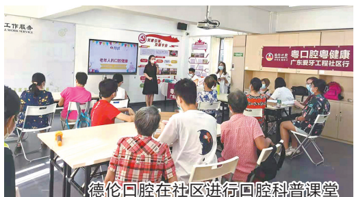
德伦口腔进社区进行口腔科普课堂

部分中老年人认为“缺颗牙不痛不痒,左边掉了,右边还可以吃饭。”“掉的牙不是门牙,不影响美观,将就就将就!”口腔专家提醒,缺牙不种不是小事!不及时修复可能危及身体健康。人体全身机能是相互关联的,所谓牵一发而动全身,缺牙如果不及时修复,将导致患者不能自如地咀嚼食物,以至于加重胃肠消化负担,牙齿缺失的人通常还会因长期使用无缺失的一侧咀嚼食物,导致歪脸,影响面容美观。