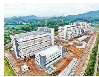
粮库项目施工现场

建设储备粮库,对于保障粮食安全具有十分重要的作用。近日,记者走访位于钟落潭镇良田村市综合保税区南区东北部的良田粮库项目时发现,该项目总建设进度已完成92%,室内装修、机电安装已进入收尾阶段,室内工程已全面铺开施工,项目整体预计7月上旬完工,9月投入试运营。