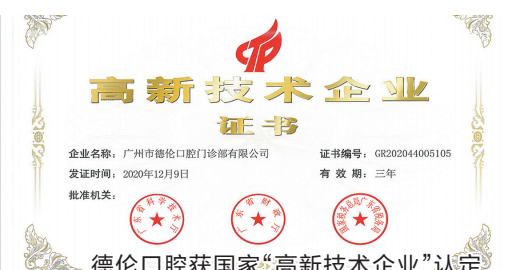
德伦口腔获国家“高新技术企业”认定

德伦口腔作为国内较早一批拥有一站式数字化种植技术的口腔机构,拥有全套数字化导板设计、经验丰富的专家团队和诊疗专家级设计团队。全套数字化种植设计软件和数字化导板输出端口,令种牙过程的所有环节均可在院内一站式完成,无需依赖第三方,导板使用率与输出量均为全国较高值。