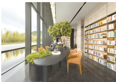
广州图书馆品秀星樾分馆将大自然带进书海

近年来，随着城市新型公共阅读空间相继落成，书香味已飘散到生活各处，融入生活场景的公共图书馆已成为滋养市民心灵的好去处。2021年广州市政府工作报告指出，“十三五”期间全市新增图书馆184家，总数达246家。值得一提的是，开在商场里、小区中的图书馆不以高墙相隔，而是以“无边界”的开放式设计与生活场景相融，进一步扩大了文化影响力。在社交平台上，这类新型阅读空间也成为年轻人们热门的“打卡”地。