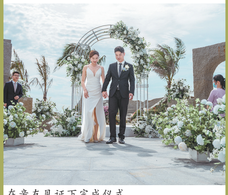
在亲友见证下完成仪式