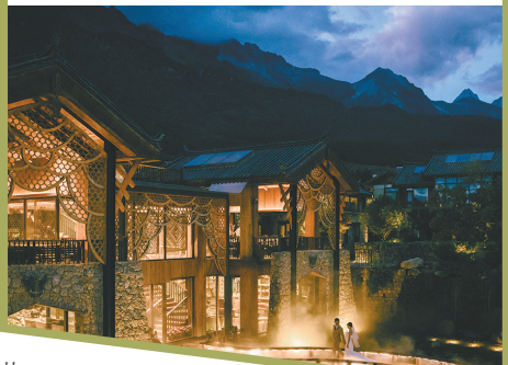
周末婚礼看重目的地的自然风光