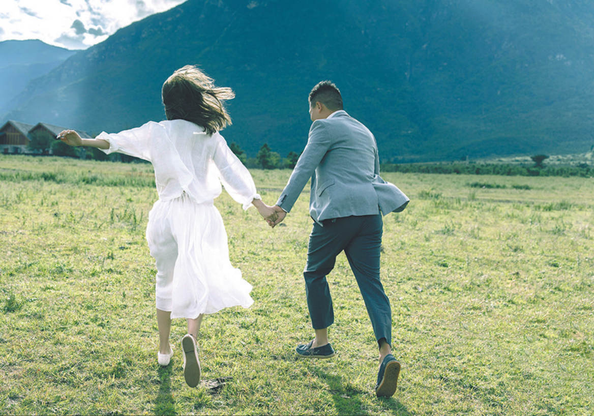
新人将婚礼变成了微度假

周末婚礼轻型、精致、低调的特点贴合了年轻一代的气质。他们不求排场和仪式，婚礼的每一处细节都彰显着年轻人的个性。