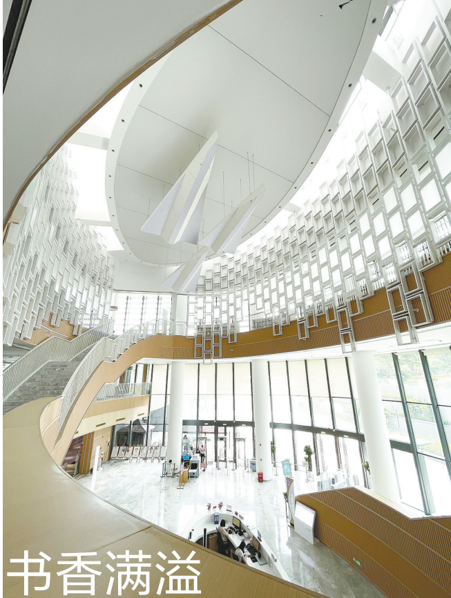
图羊城晚报记者 马思泳（除署名外）文羊城晚报记者 施沛霖