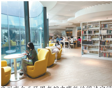
广州市白云区图书馆内宽敞的阅读空间