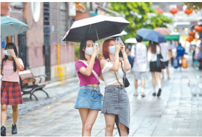
如今的惠吉西吸引不少年轻人来“赶潮”

上世纪二三十年代，回国的华侨在这一带置业。一时间，一栋栋传统岭南竹筒屋、独栋小洋房在这里拔地而起。说不不知道，仅几百米的街道竟就隐藏了一处文物遗址、72处民国时期的传