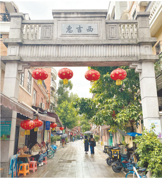
烟火味与新潮在这里共生共存