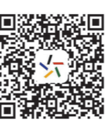
广东体彩网点征召平台