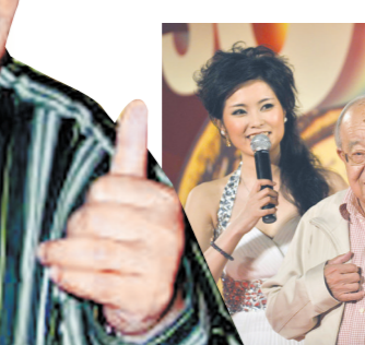
2008年，乔羽在深圳参加全国流行音乐盛典暨改革开放三十年流行金曲颁奖晚会