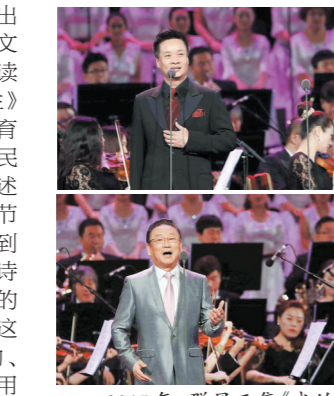
2015年，群星云集《我的祖国》——乔羽作品音乐会

1948年年底，在当时的北平即将和平解放时，乔羽带领长辛店3000多名工人参加了入城彩排。1949年10月1日新中国成立，当时的乔羽21岁，他也在这一年加入了中国共产党。