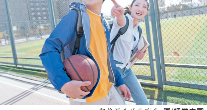
即将毕业的体育生

相较于一线、新一线城市人才饱和、工作节奏紧张、生活压力大，也有不少体育生将三、四线城市作为自己的理想就业地。