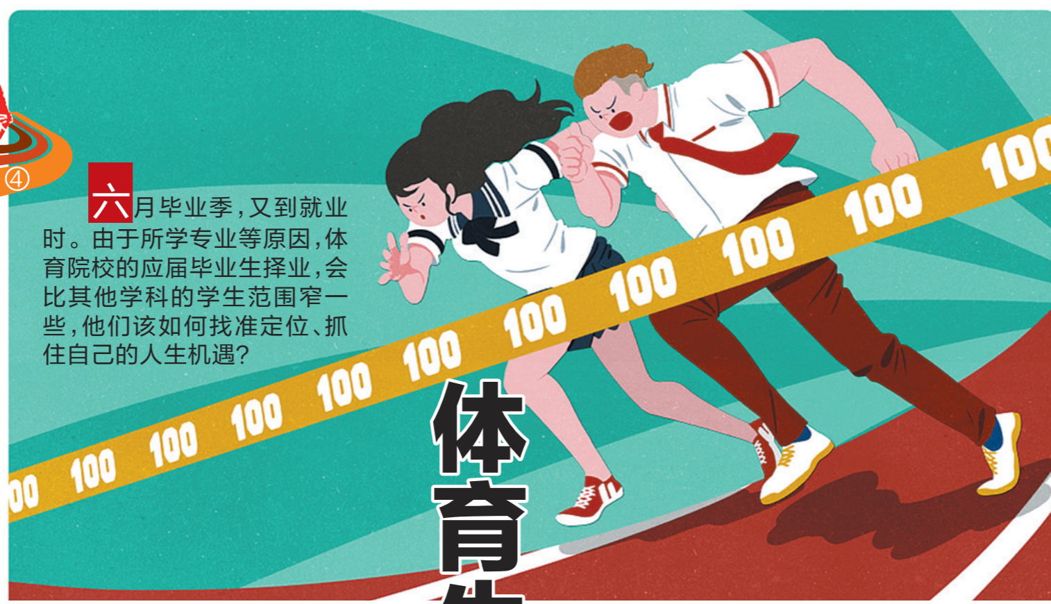
体育院校的应届毕业生如何抓住人生机遇？