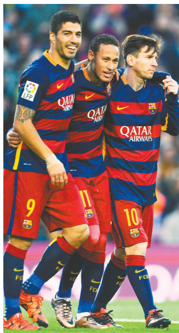
曾一同效力巴塞罗那的梅西（右）、苏亚雷斯（左）和内马尔