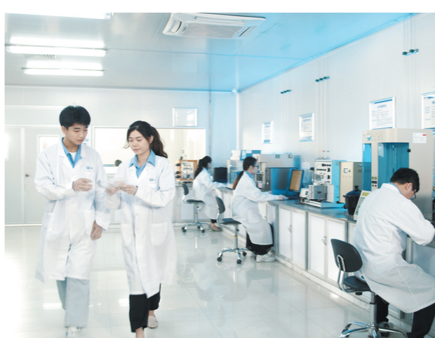
潮州力争至2025年实现高新技术企业数量倍增，图为该市三环集团的科创工作室