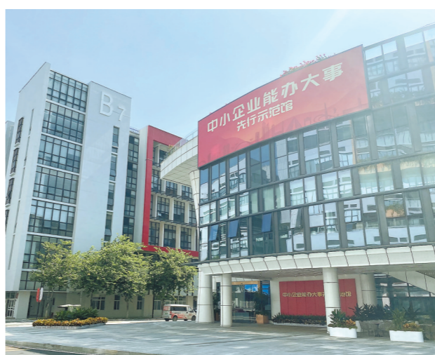
广州开发区目前已聚集中小企业4万多家，图为该区建设的“中小企业能办大事”先行示范馆