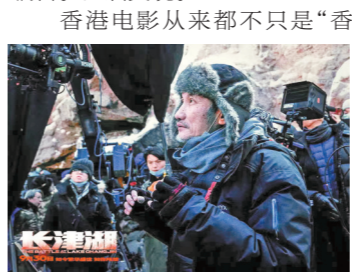
徐克在《长津湖》片场

说起香港电影的繁荣，香港电影工作者总会发言人田启文用了“时势造英雄”五个字来形容。吴宇森的血色浪漫、徐克的天马行空、周星驰的小人物喜剧……香港电影产量高、题材多、创作上不拘一格，使其有着迥异于其他地区电影的独特面貌，也因此获得“东方好莱坞”的美誉。“在很长一段时间里，香港电影的最大优势在于创意和制作。我们这么小的地方，最高年产纪录可以达到400部，每天起码开拍一部，而且题材十分多样。不同的题材能够吸引到不同地区、不同口味的人，因此香港电影曾有一段时间受到全球瞩目。”田启文说。