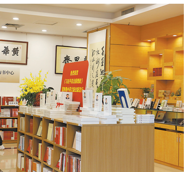
黄花园书屋

羊城晚报记者 黄宙辉 通讯员 敖卓瑞 7月13日,广州首个“书香羊城全民阅读共建点”在中共广东省委党校揭牌。该“共建点”由书香羊城全民阅读活动组委会与中共广东省委党校(广东行政学院)联合共建,打造高品质全民阅读“党校样板”。