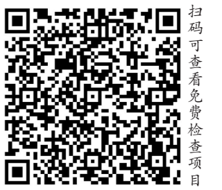
扫码可查 查看免费检查项目

一方或双方为广州市户籍或持有有效《广东省居住证》(在广州市申办或签注)的登记结婚人员,可在预约结婚登记后至怀孕3个月内享受一次免费婚前孕前健康检查。符合再生育政策的,按规定每人次可以继续享受一次免费孕前优生健康检查服务。